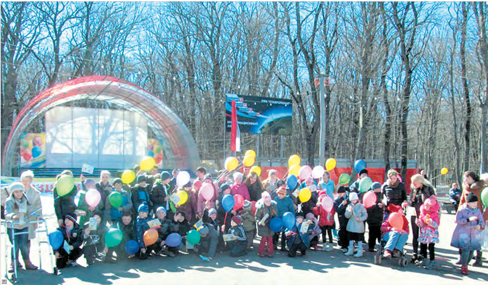
В парке Победы Ставропольской городской общественной организацией инвалидов «Вольница» была проведена акция в поддержку инклюзивного образования «Все дети должны учиться вместе».

товано 20 классов со средней наполняемостью 12 человек, а также 20 групп продленного дня. Дети обучаются в школе 9 лет. С 1997 года открыт 10-й профессиональный класс с углубленной трудовой подготовкой, дающий возможность повышения уровня профессионально-трудовой подготовки и работы на промышленных предприятиях и в сфере обслуживания населения.