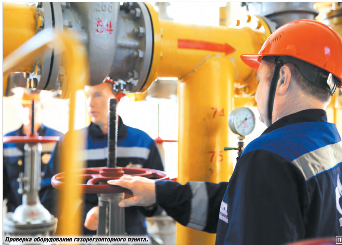
Проверка оборудования газорегуляторного пункта.

Пусть новый, 2016 год станет плодотворным во всех делах и начинаниях, а мы приложим все усилия для того, чтобы газоснабжение в праздничные дни было бесперебойным и безаварийным!