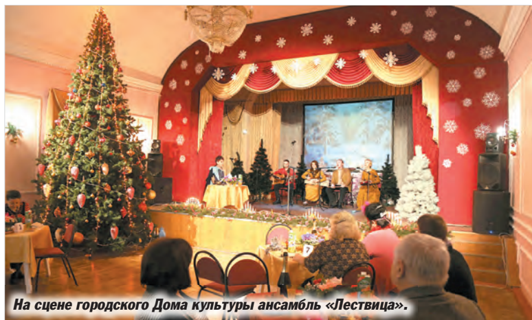
На сцене городского Дома культуры ансамбль «Лествица».