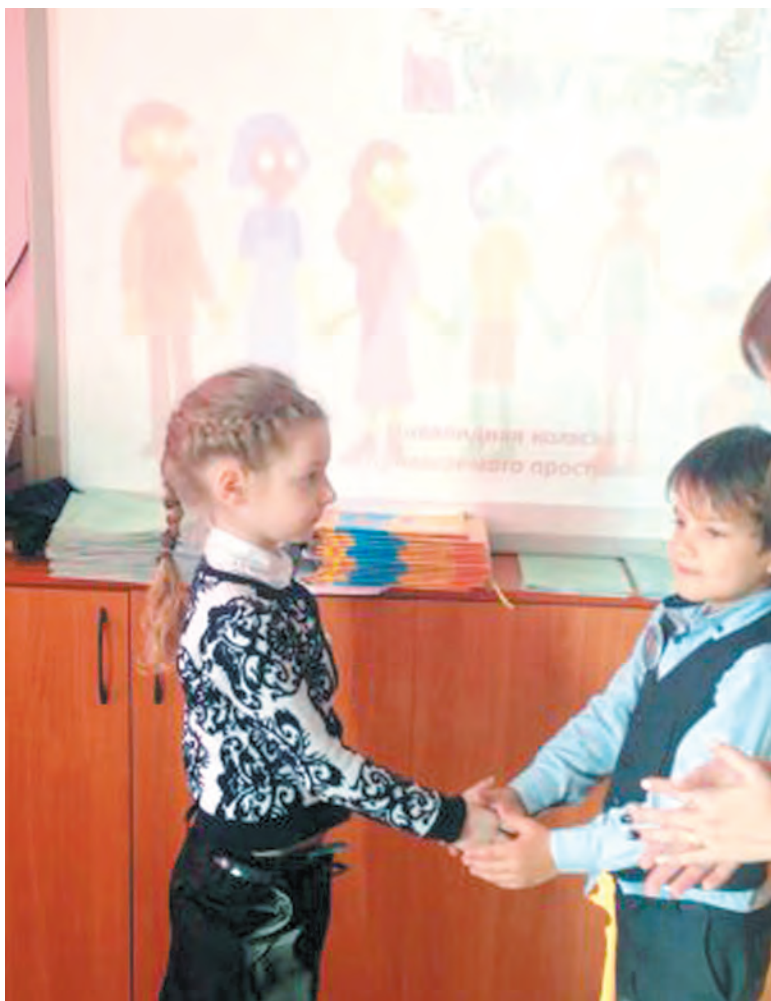
В пятигорской школе № 30 с детства учат самоуправлению.

Одним из важнейших органов самоуправления в интеллектуальной сфере деятельности школы является Малая академия наук (МАН). Среди задач МАН - раннее раскрытие интересов и склонностей учащихся к научно-исследовательской работе, развитие исследовательских умений и навыков и творческой активности учащихся, создание условий для развития творческого теоретического и логического мышления, создание научно-исследователь-