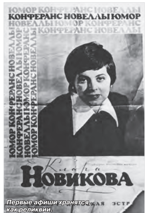
Первые афиши хранятся, как реликвии.