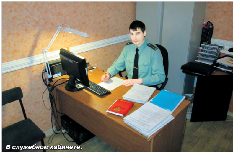
В служебном кабинете.