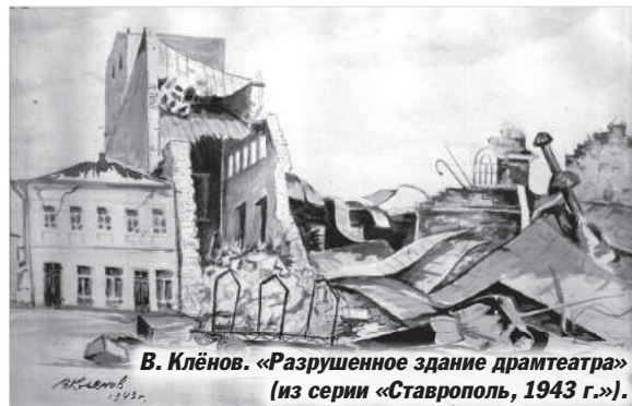
В. Клёнов. «Разрушенное здание драмтеатра» (из серии «Ставрополь, 1943 г.»).

Ольга МЕТЕЛКИНА. Рисунки художника В. Клёнова из фондов Ставропольского государственного музея-заповедника имени Г.Н. Прозрителева и Г.К. Праве.