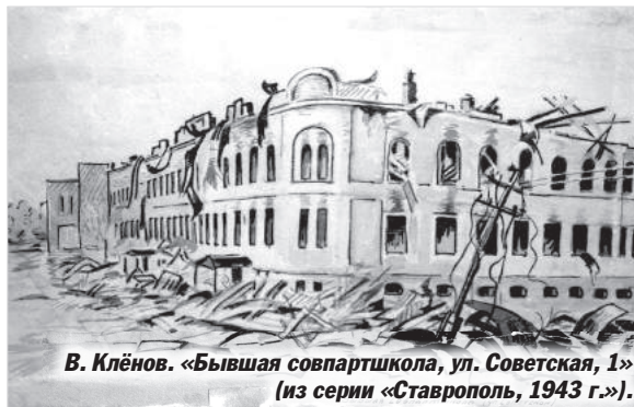
В. Клёнов. «Бывшая совпартшкола, ул. Советская, 1» (из серии «Ставрополь, 1943 г.»).