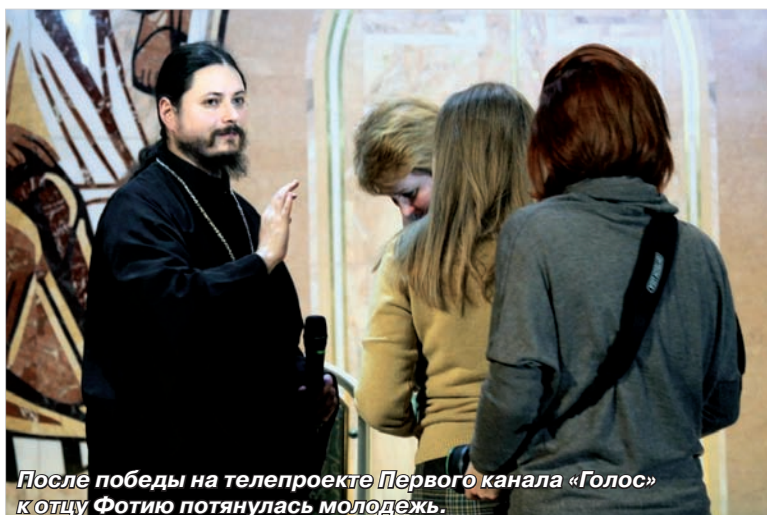
После победы на телепроекте Первого канала «Голос» к отцу Фотию потянулась молодежь.

этого люди не приезжают. Все же я не экспонат какой-то. Те, кто хочет на меня посмотреть, больше стремятся попасть на те мероприятия, где я буду участвовать. А те, кто особенно полюбил мое творчество, следят за новостями в социальных сетях, где я появляюсь.