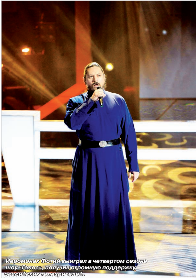
Иеромонах Фотий выиграл в четвертом сезоне шоу «Голос», получив огромную поддержку российских телезрителей.