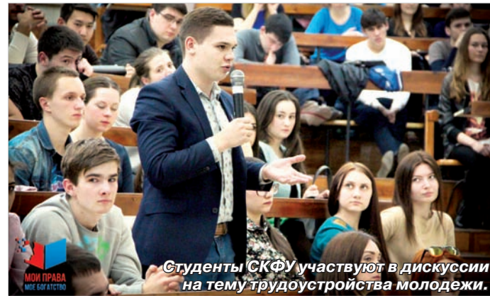
Студенты СКФУ участвуют в дискуссии на тему трудоустройства молодежи.

В Ставрополе завершился своеобразный студенческий марафон «Мои права – мое богатство». Этот проект стал победителем конкурса молодежных проектов Всероссийского молодежного форума «Территория смыслов на Клязьме».