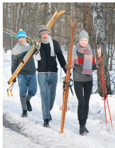
Из леса вышли натуральные советские лыжники.

Повсюду мы видим различные автомобили советских времен. Как нам рассказали, все они - на ходу. Недавно, например, тут снимали погоню, в которой участвовало одно из раритетных авто. Вокруг машин ходят люди из массовки в одеждах 70-х годов.