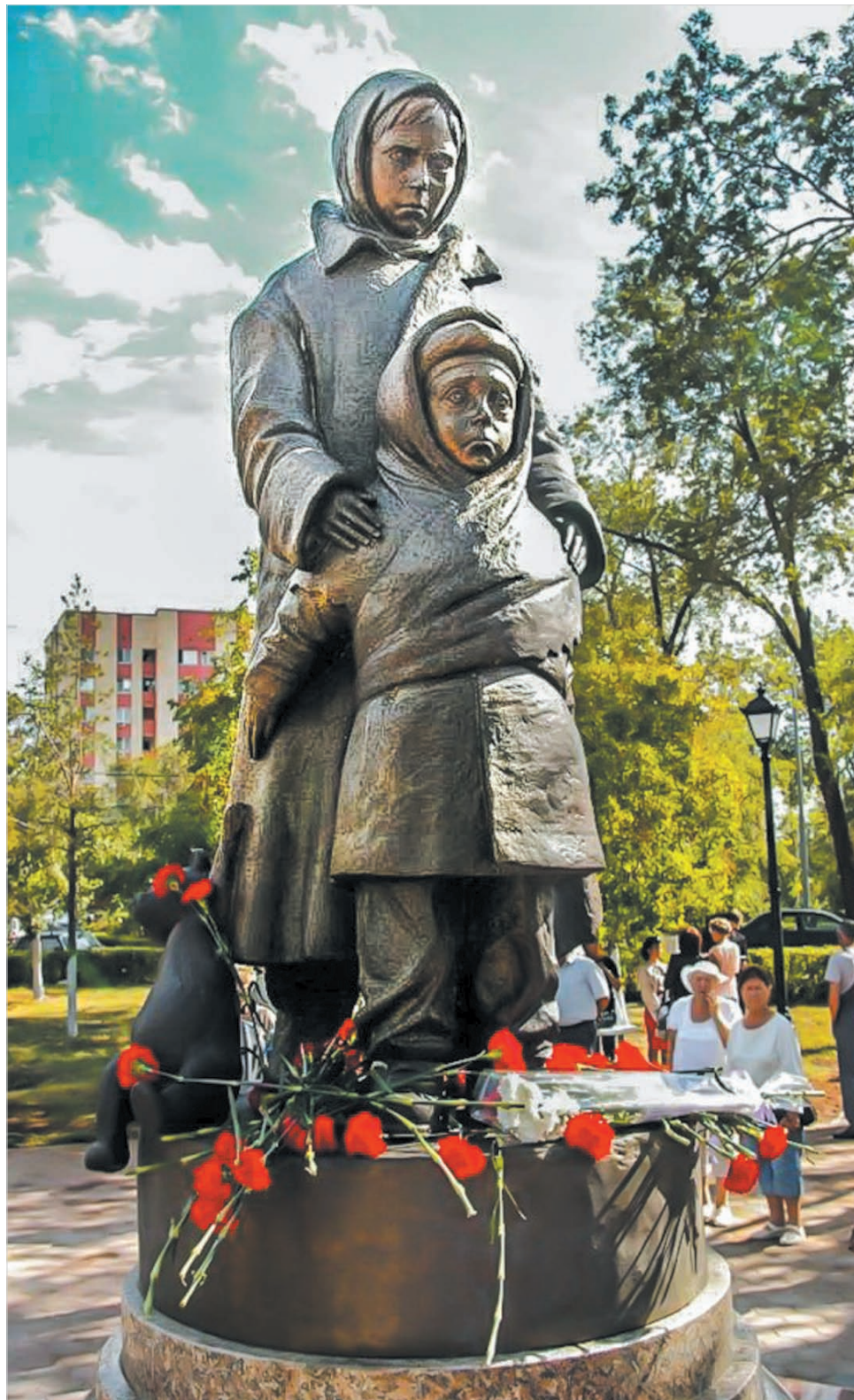
Памятник детям войны.