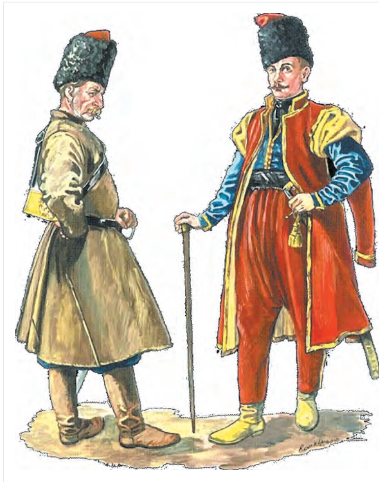
Казаки-хоперцы в XIX веке.

Жители Пристанского городка приняли самое активное участие в восстании Степана Разина (1670—1671). В 1669 году походный атаман Разин лично посетил Хопёрский округ. Он был рассматривался им как возможный стратегический