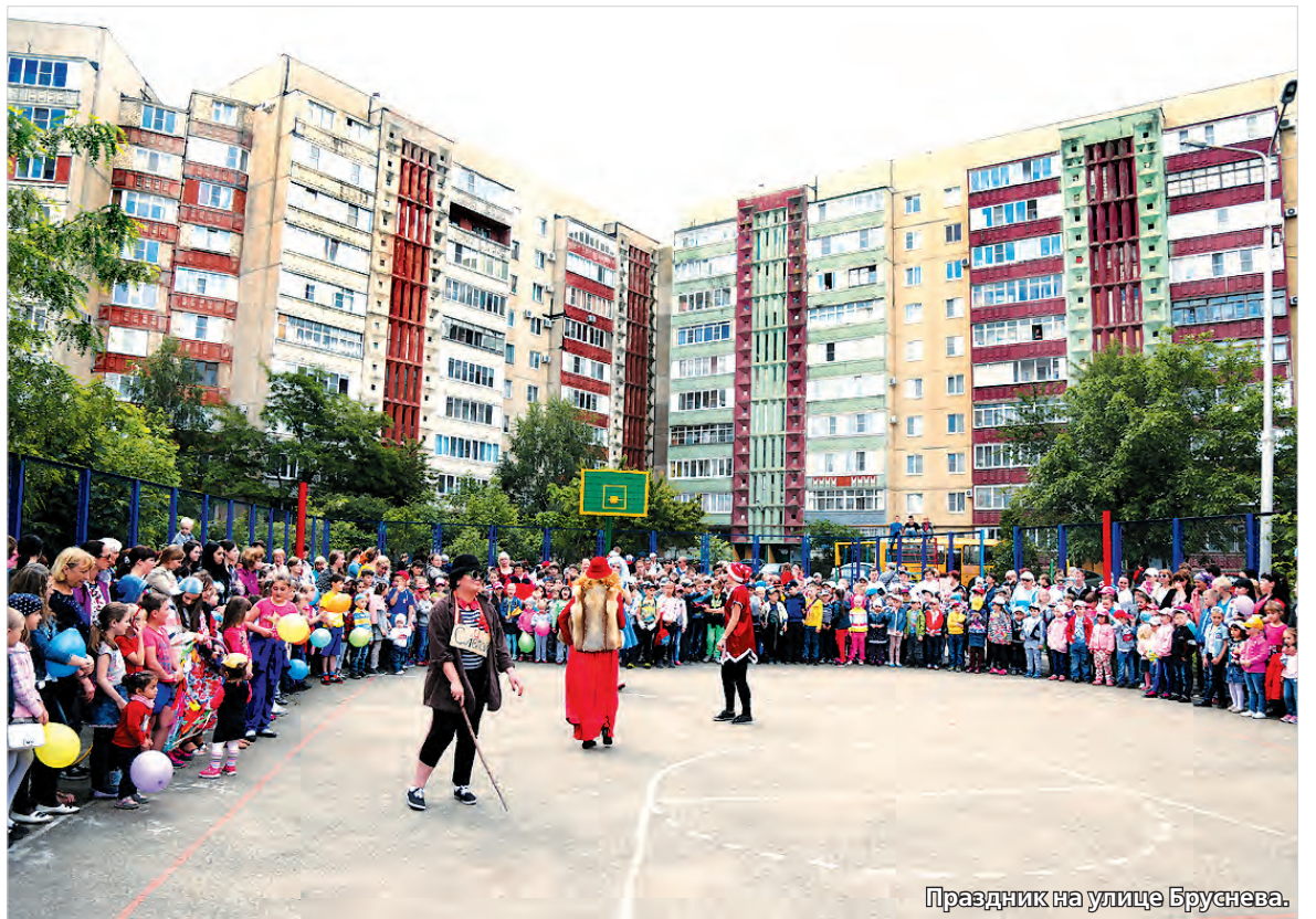
Праздник на улице Бруснева.

И детям, и взрослым праздник понравился: сотни мальчишек и девчонок начали летние каникулы радостно и весело.