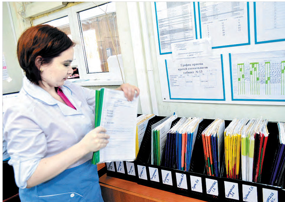
Поликлиника № 1: карты пациентов готовят для доставки к врачу.