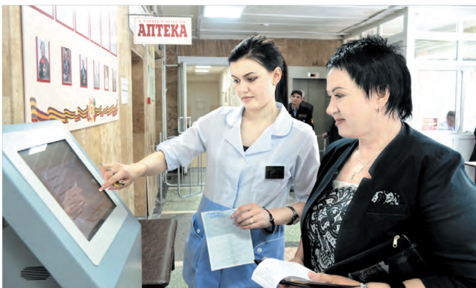
Поликлиника № 1 г. Ставрополя: записаться по инфомату можно к любому врачу.

участковые терапевты. Если пациенты записались на прием через инфомат и Интернет, людям сейчас не нужно обращаться в регистратуру за картами. Документы попадут в кабинет врача без их участия.