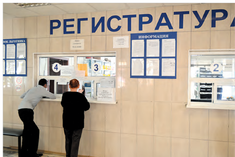
Регистратура КДП: очередей нет.