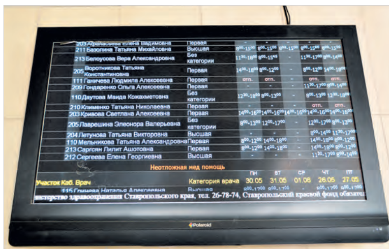
Консультативно-диагностическая поликлиника (КДП): на электронном табло график работы врачей – в режиме онлайн.