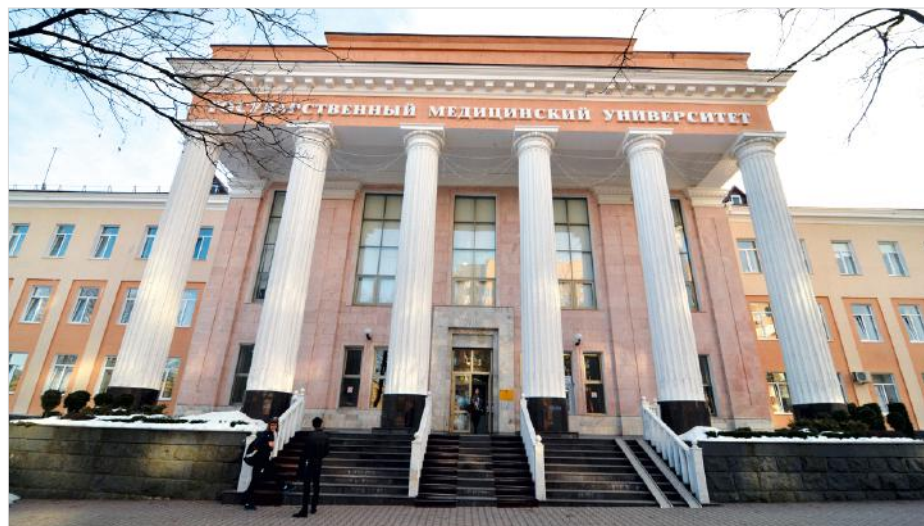
Главный корпус Ставропольского государственного медицинского университета (современный вид).