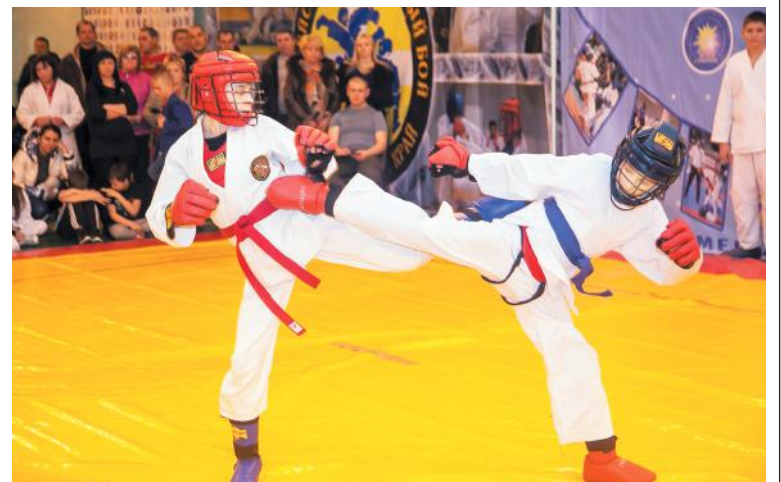
Идет рукопашный бой.