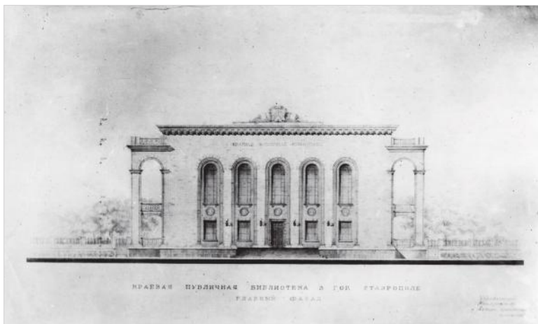
Один из вариантов проекта краевой библиотеки в Ставрополе.