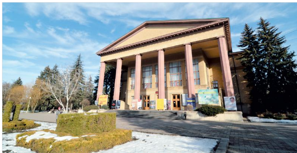
Ставропольский академический театр драмы имени М.Лермонтова был построен по проекту архитекторов Лысяковых.