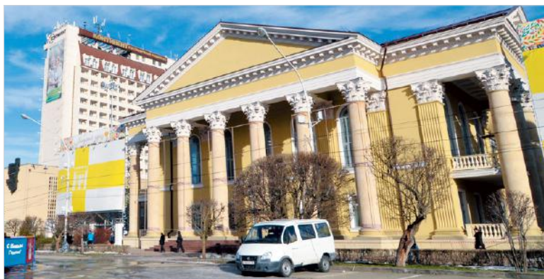
Комплекс зданий на площади Ленина в Ставрополе.