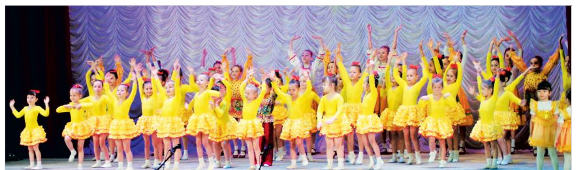
На церемонии открытия.

На церемонии награждения участникам конкурса были вручены медали и статуэтки с символикой конкурса, дипломы, сладкие призы и билеты в кино.