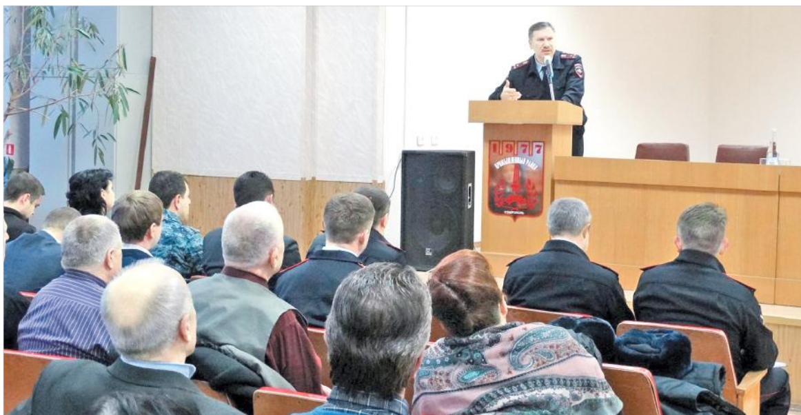
Начальник УМВД России по г. Ставрополю Вадим Середин отчитался перед населением.

Однако радоваться рано: в прошедшем году резко выросло количество мошенничеств — те-