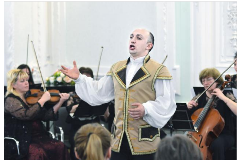
Антон Дурахов в роли Фигаро.