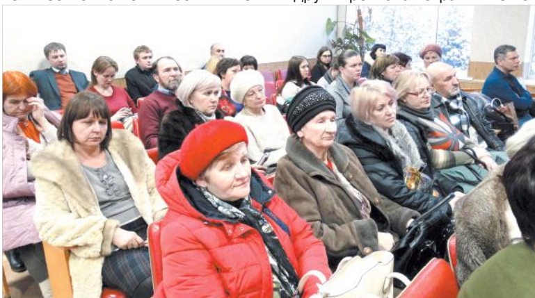
Традиционно зал был полон.