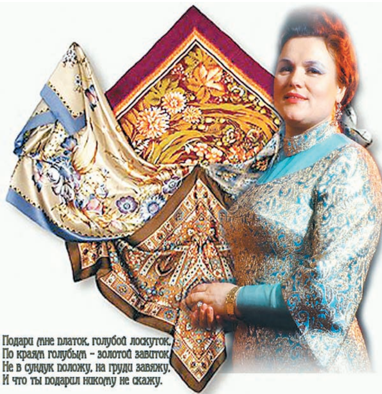
Подари мне платок, голубой лоскуток. По краям голубым - золотой завитушкой. Не в сундук положу, на груди завяжу. И что ты подарил никому не скажу.

И, когда поешь эти песни, приходишь к парадоксальному выводу, что мы в современной жизни перестали пользоваться жанром этакой культурной самоподдержки. Эти песни мелодичны и приятны к восприятию, но (!) текст, вернее, замысел уже не соответствует сегодняшнему дню. Уже, быть может, к сожалению, никто никому не дарит тех самых платков, в которые можно было укутаться, и никто уж тем более не будет вязать на них узелки. Теперь дарят золотые побрякушки или машины своим любовницам.