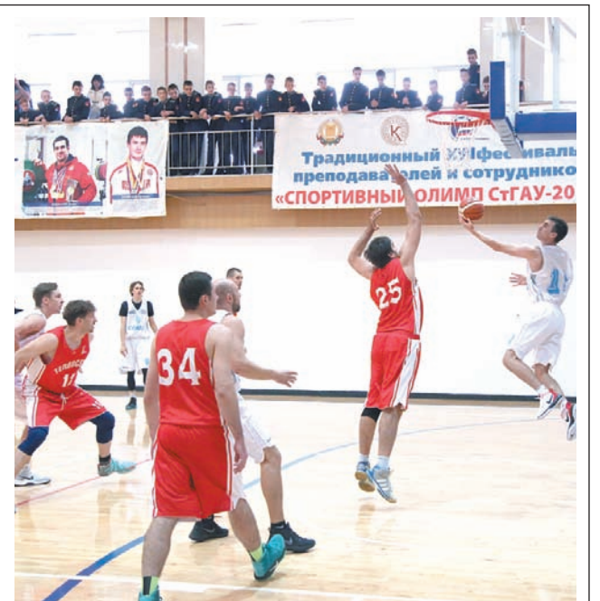
Сражение в воздухе.