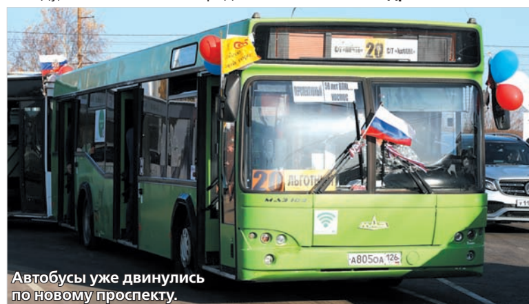
Автобусы уже двинулись по новому проспекту.