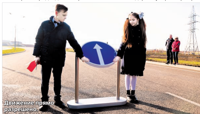
Движение прямо разрешено.

Наталья АРДАЛИНА.