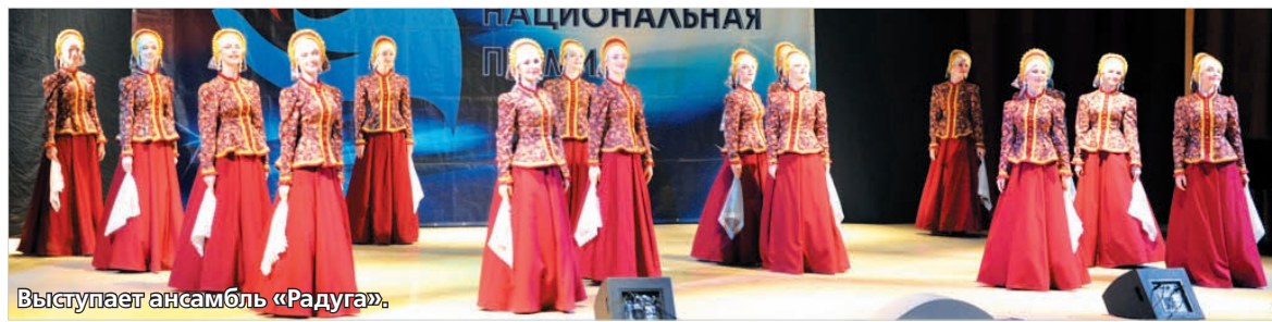
Выступает ансамбль «Радуга».

Таким образом, пять из шести ансамблей хореографической школы приглашены в Москву представлять наш регион в финале III Национальной премии в области культуры и искусства «Будущее России» весной 2018 года.