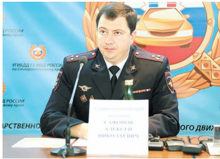
Начальник краевого управления Госавтоинспекции полковник полиции Алексей Сафонов.

До конца года 15 камер фиксации нарушений будут установлены в городе Ставрополе и вблизи него, на наиболее аварийных перекрестках, где происшествия происходят по причине выезда на запрещенный сигнал светофора, из-за нарушения скоростного режима и выезда на встречную полосу. В течение ближайших 9 месяцев проект будет полностью реализован: около 12 камер появятся на федеральной трассе «Кавказ», несколько - в городе Минеральные Воды, через который прохо-