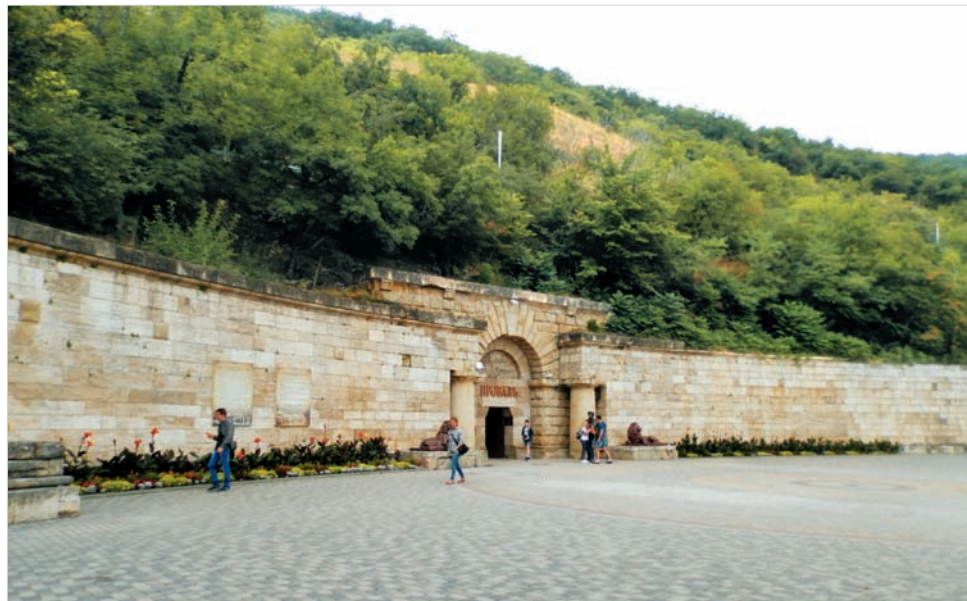
Памятник природы Провал – одно из популярных у туристов мест.