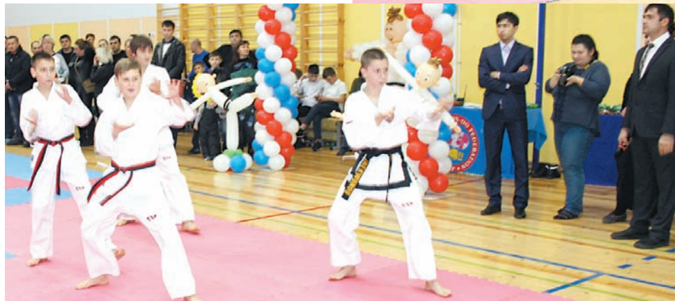
нов и расширением географии участников. Опытных спортсменов наряду с новичками позволяет первым делиться опытом

Организовавший турнир клуб «Торнадо» существует в Ставрополе более 10 лет. За это время среди его воспитанников появились призеры и чемпионы России, победители различных турниров. Клуб организовал множество соревнований, и каждый новый турнир радует ростом числа спортсме-