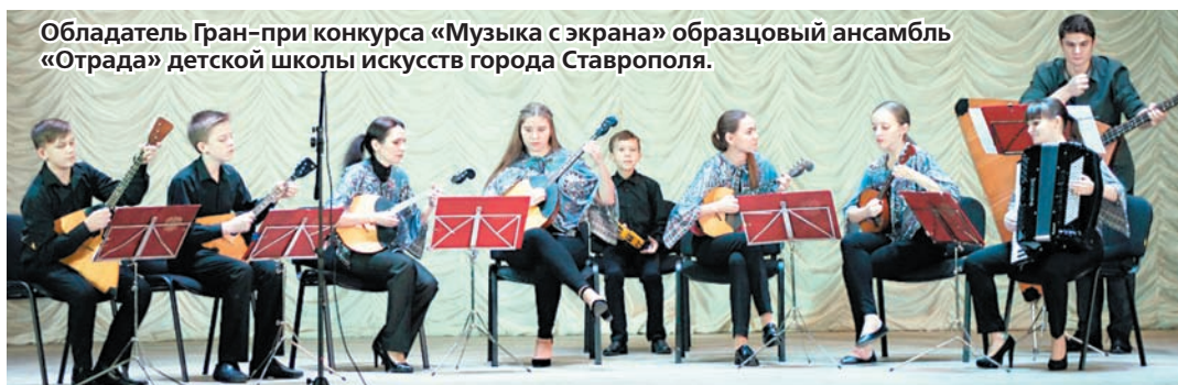
Обладатель Гран-при конкурса «Музыка с экрана» образцовый ансамбль «Отрада» детской школы искусств города Ставрополя.

«пробный старт» был дан ему ещё в январе нынешнего года. Тогда в нём участвовали только ученики ДШИ. Но «Музыка с экрана» заинтересовала юных музыкантов и их преподавателей из многих учреждений культуры Ставро-