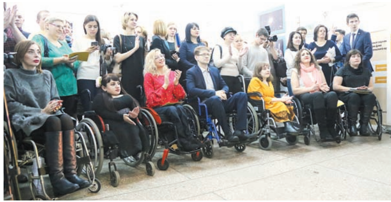
Герои проекта «Диалог равенства».

Она состоялась в рамках социокультурного проекта, одна из задач которого - привлечь внимание общества к вопросу равенства людей с инвалидностью в обществе и культуре, а также помочь молодым людям с инвалидностью в решении проблемы их социальной изоляции.