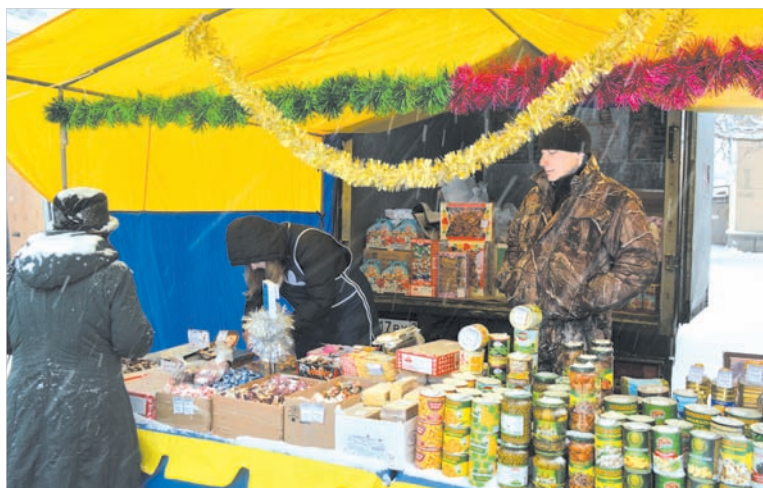
К новогоднему столу — и консервы, и конфеты.