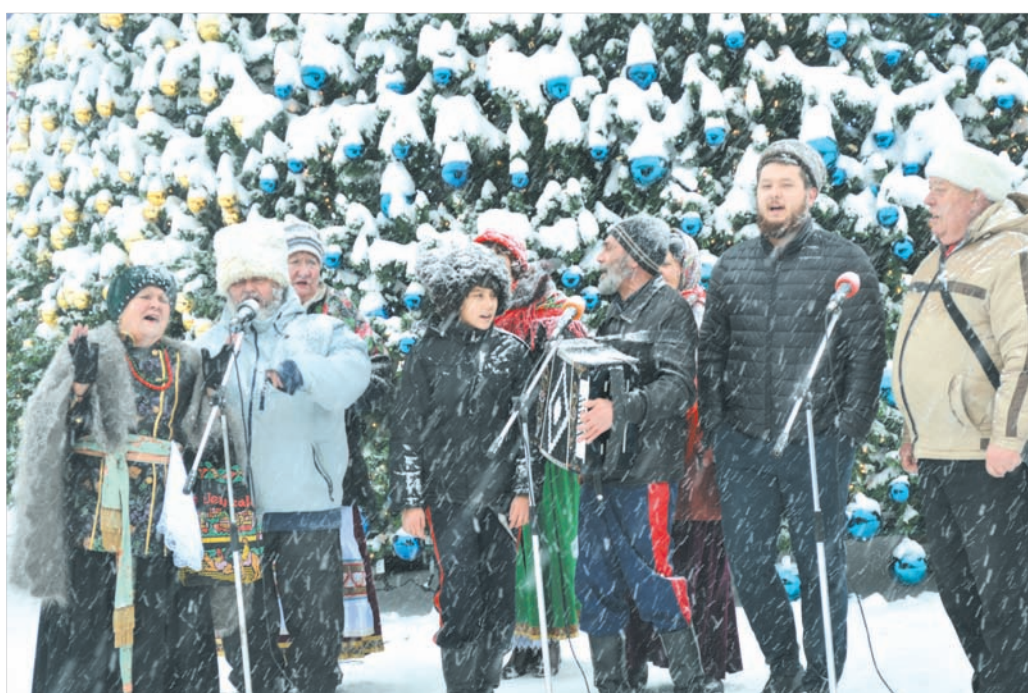
Артисты поднимали настроение.

В торговой точке последнего торговля, как