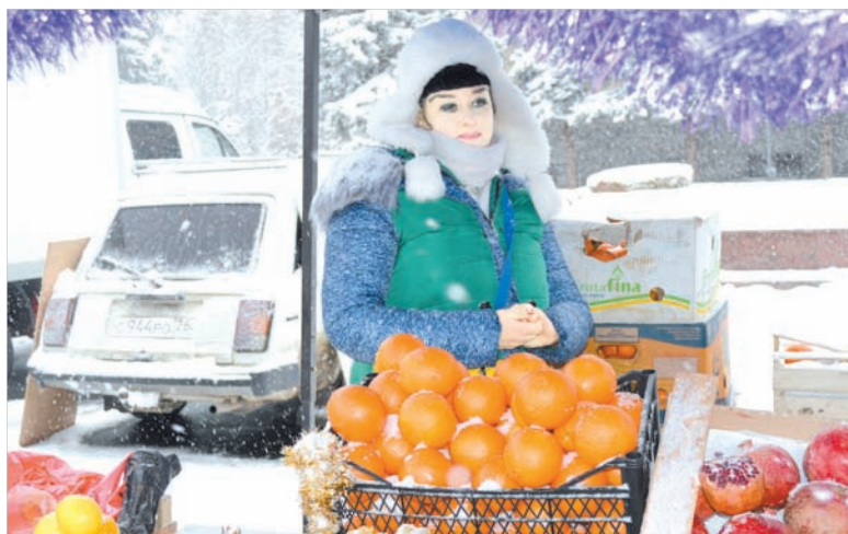
Продавцам пришлось одеться потеплее.