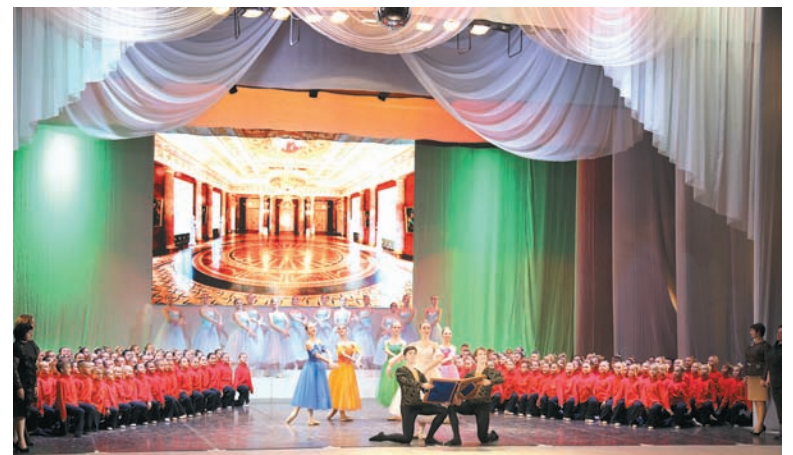
Первоклассники дали клятву Терпсихоре.

Александр Павлович рассказал также о другом предстоящем событии. В ноябре в Ставрополе прошел отборочный тур III Национальной премии «Будущее России». В рамках большого проекта, который курирует Правительство Российской Федерации, известные хореографы из состава жюри премии просмотрели в краевом центре выступления коллективов, претендующих на участие в финале.