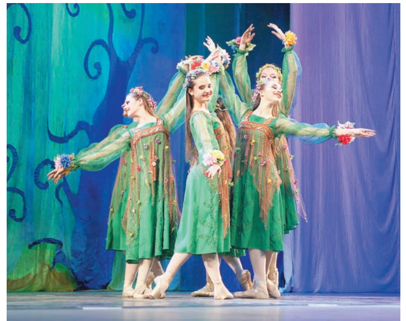
Праздник посвящения – феерия танца.

Он будет проходить в Москве в марте 2018 года.