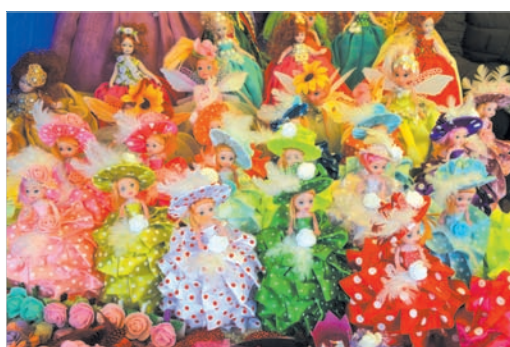
Подделки - от мастеров народного промысла.