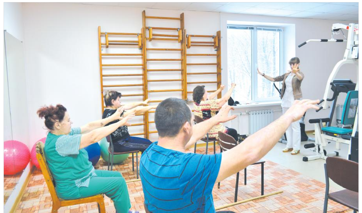
В зале ЛФК идут групповые занятия.