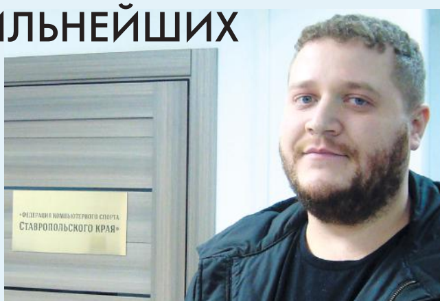
Региональный представитель Федерации компьютерного спорта России.

- Я в студенчестве увлекался играми. Правда, с 2003-2004 годов уже не тренировался. Потом получилось