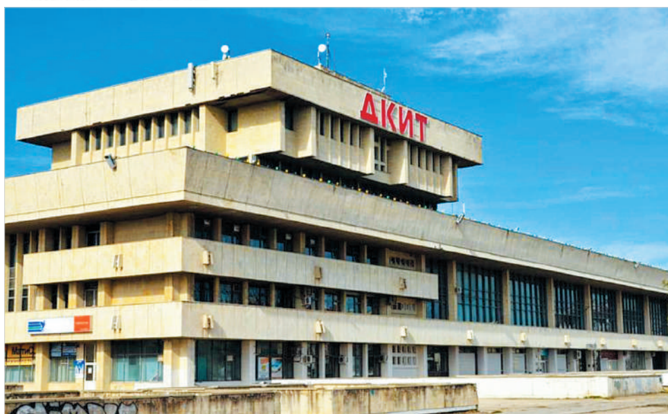
Дворец-близнец в Тольятти.