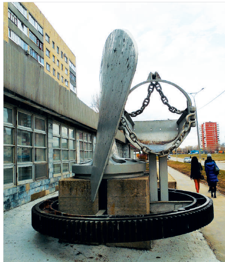
Арт-объект возле местного краеведческого музея, созданный Владимиром Никитиным в 1983 году, смотрится сегодня весьма креативно.