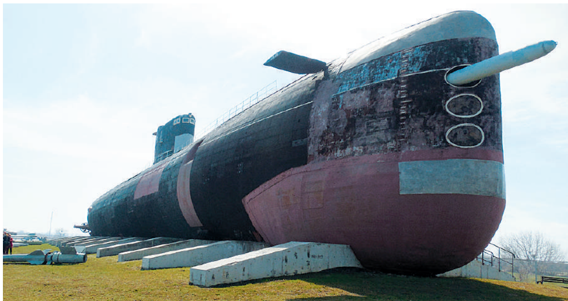
Ах вот ты какой «СОМ»!