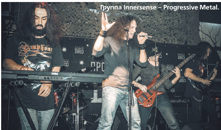
Группа Innersense – Progressive Metal.

Мероприятие органично вошло в перечень памятных и патриотических акций, проходящих в Ставрополе в честь 72-й годовщины Великой Победы.