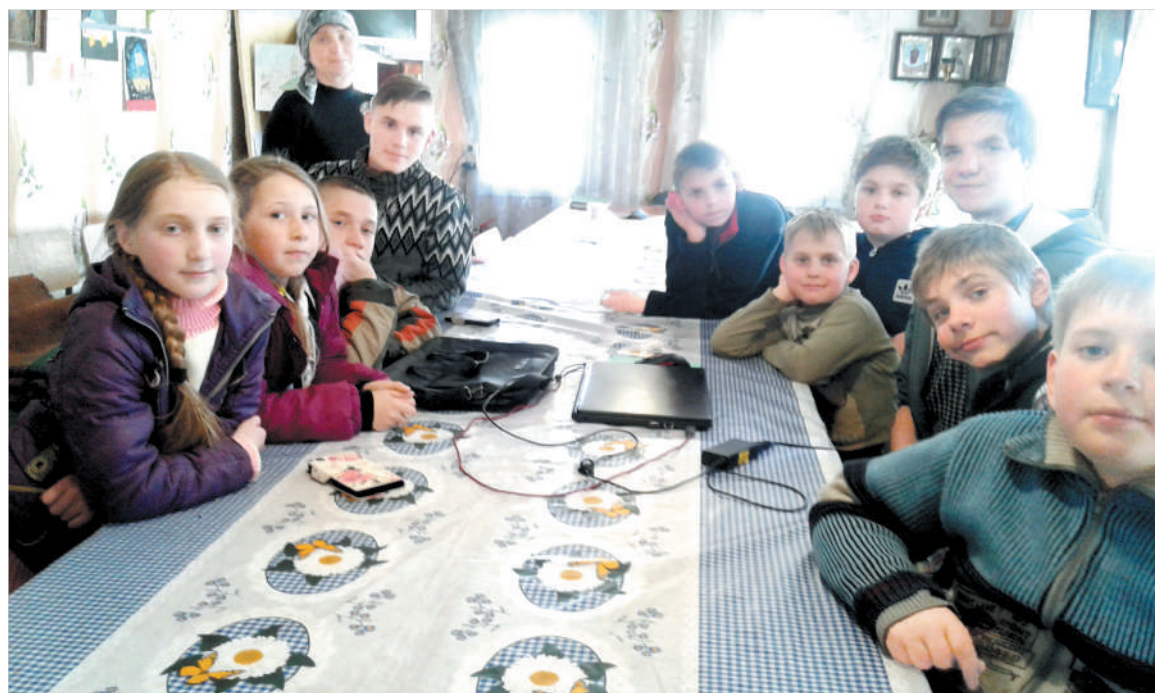
Дети войны взрослеют рано. Воспитанники Первомайской церковно-приходской школы.

Конечно, все познается в сравнении. Нынче, слава Богу, не лето 2014-го и не зима 2015-го, когда тот же Первомайск в пыль