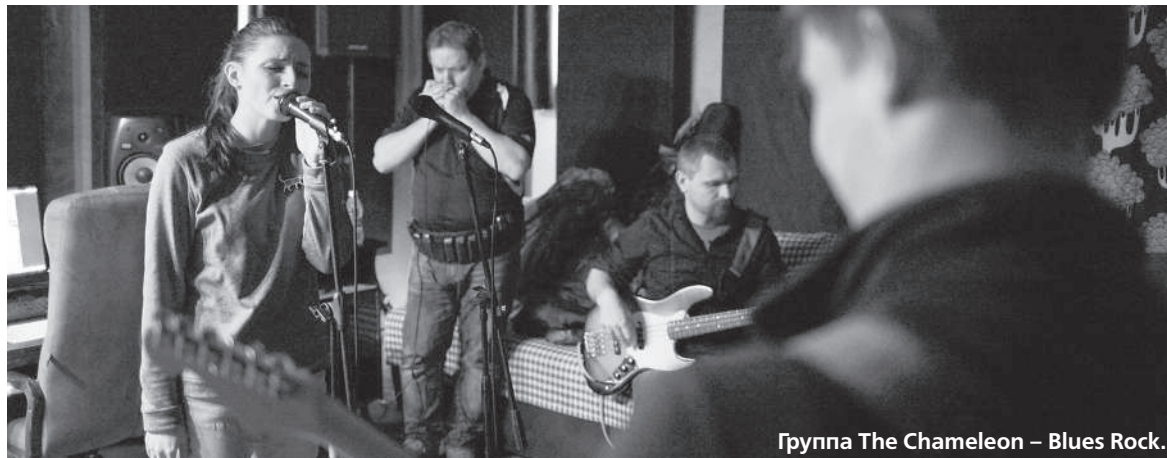
Группа The Chameleon – Blues Rock.

Итак, первое состязание прошло 3 мая, на сцене сошлись команды We Ska's и Apocalypse