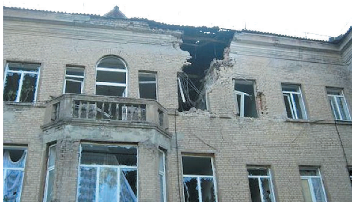
Фрагмент здания Первомайской больницы имени Менжинского — после обстрела.