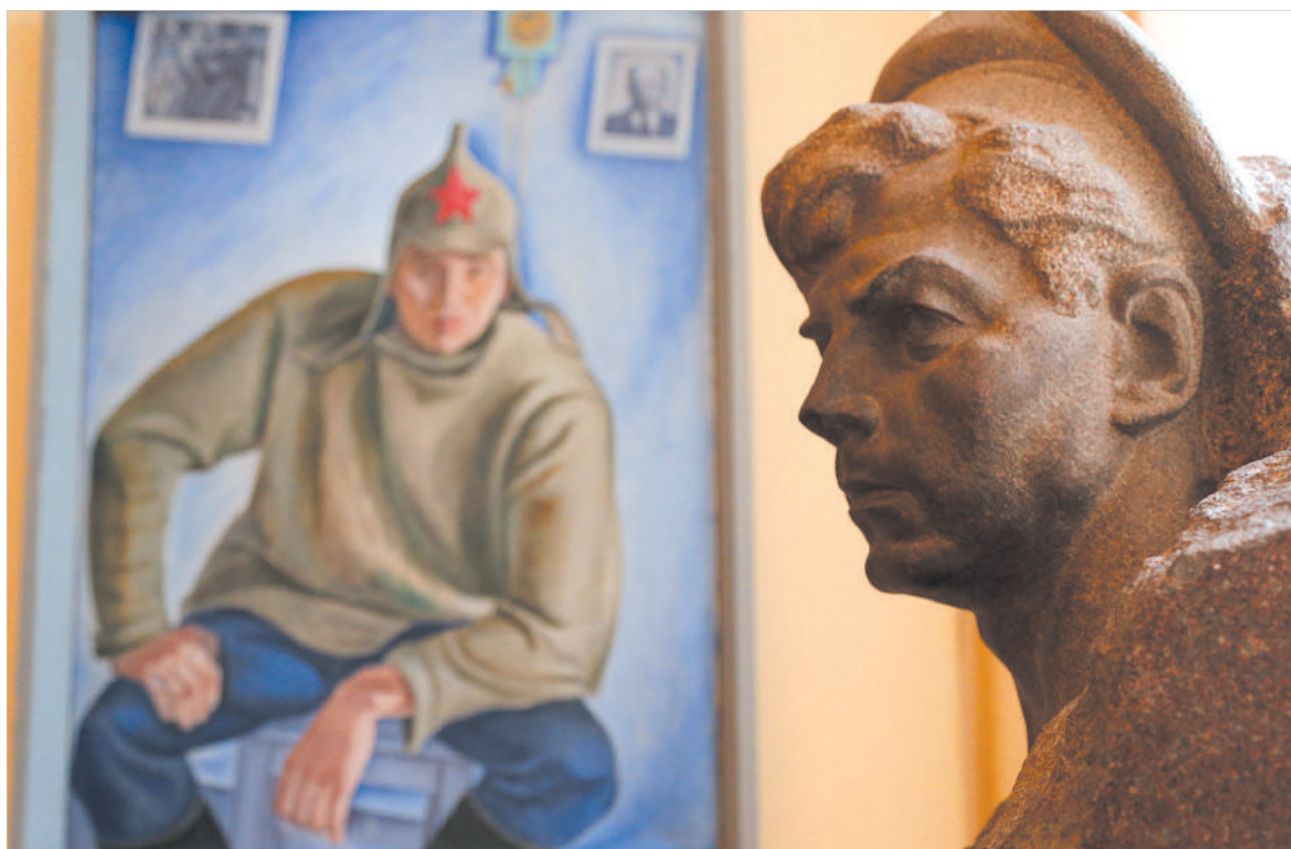
На выставке в Ставропольском краевом музее изобразительных искусств.

А в субботу вечером музеи края откроют свои двери в неурочное вечернее время, потому что 20 мая они примут участие в традиционной «Ночи музеев». Этого события заядлые посети-