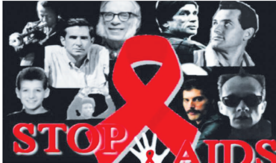
Нас убил СПИД!

В России объявлена неделя борьбы со СПИДом. На открытии недели в новостях «прокрутили» интересную информацию: на сегодня в стране зарегистрировано 900 тысяч ВИЧ-инфицированных, каждые пять минут заражается один человек, и в двухтысячном году мы стояли на пороге эпидемии. Как-то сразу возник вопрос: а если каждые пять минут заражаются – это не эпидемия разве? Что-то напутали с цифрами наши статистики... И если учесть, что в приведенных для примера городах Екатеринбурге и Новосибирске каждый пятидесятый и каждый сотый ВИЧ-инфицированы – это что? Еще не эпидемия разве?