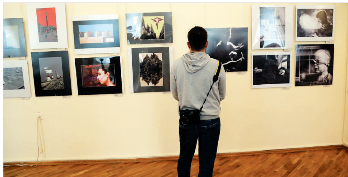
На выставке «Мир вокруг нас».