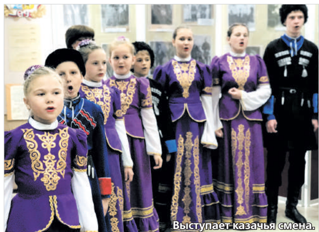
Выступает казачья смена.

Выставка подготовлена архивным отделом по материалам из фондов Российского государственного военно-ис-