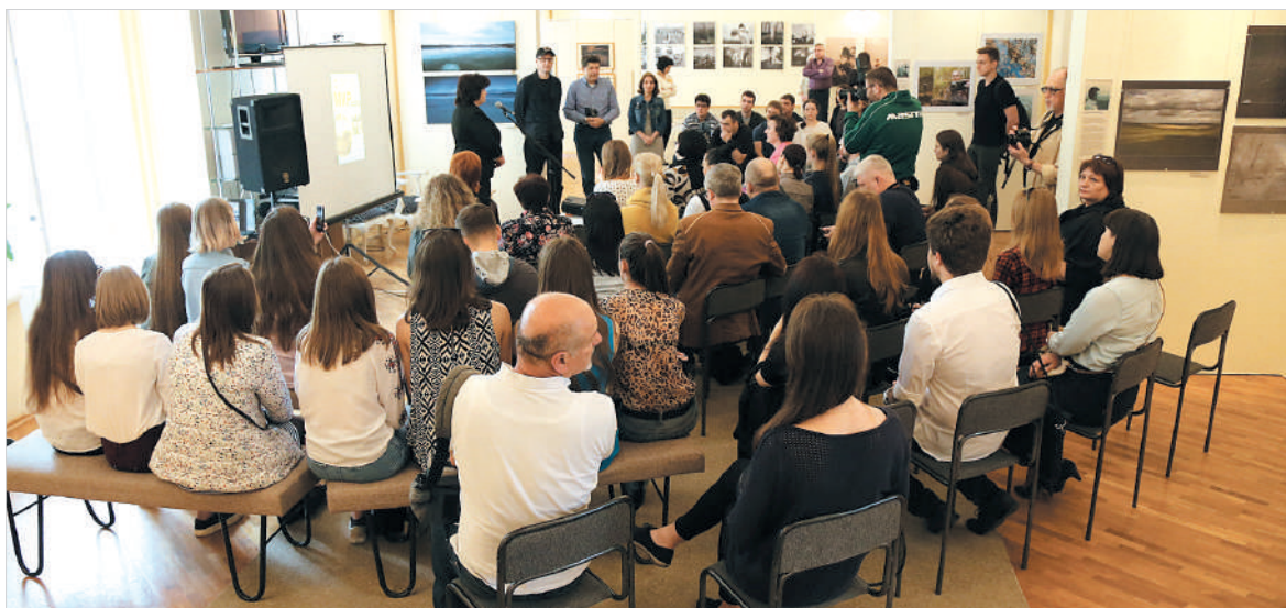
На открытии Дней фотографии в Ставропольском краевом музее изобразительных искусств.