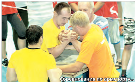
Соревнования по армспорту...