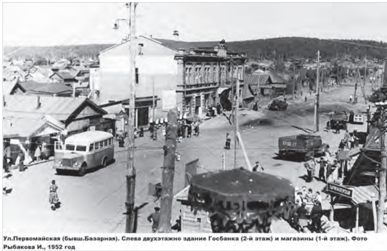
Ул. Первомайская (бывш. Базарная). Слева двухэтажное здание Госбанка (2-й этаж) и магазины (1-й этаж). 1952 год