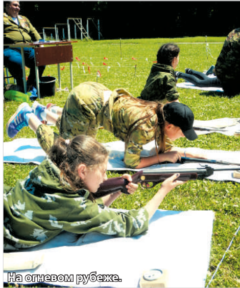
На огневом рубеже.