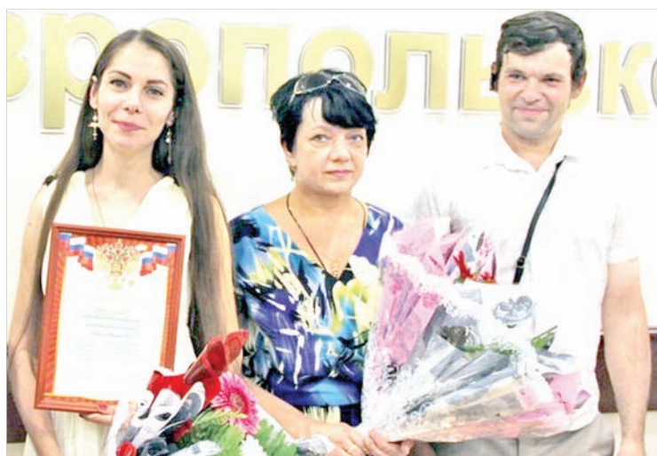
Члены отряда «Поиск 26».