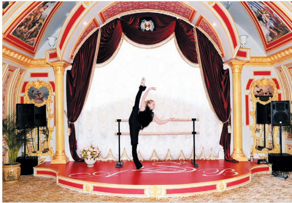
Ежедневные занятия у станка помогают балерине постоянно быть в форме.

Для проведения ремонтных работ балерине посоветовали нанять прораба из Твери, а