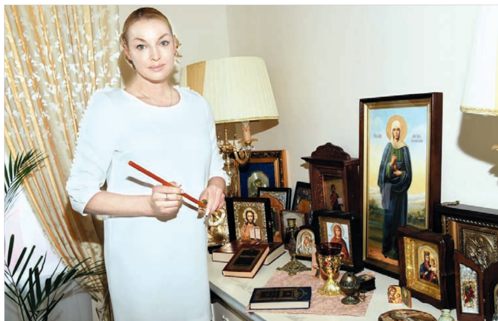
В кабинете балерины есть уголок для молитв.

Материал предоставлен ООО «Столица» специально для «Вечернего Ставрополя»