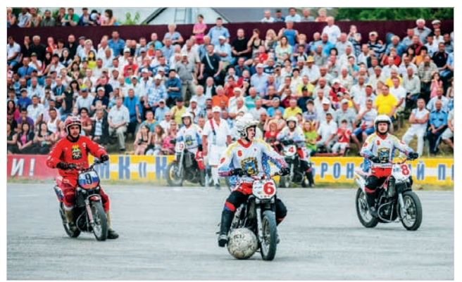
В атаке «Колос-3».