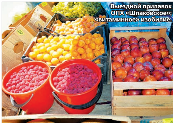
Выездной прилавок ОПХ «Шпаковское»: «витаминное» изобилие.