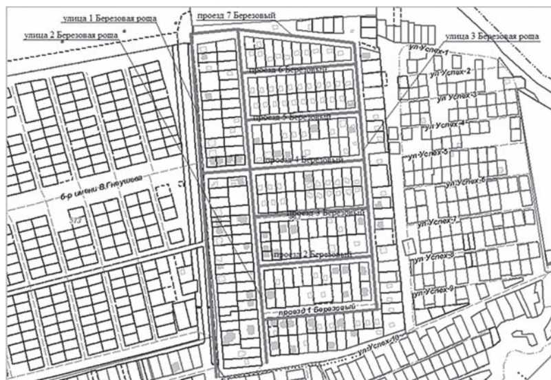
СХЕМА расположения улиц в 443 квартале города Ставрополя