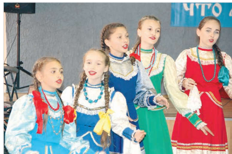
Песня — душа народа.

по-настоящему: меняя тембр и интонации, возвышая голоса почти в литургическом пении, когда требовалось, например, артистически показать церковную службу, материнский крик или звук выстрела... В этом зале хотелось пребывать вечно, и верилось, что именно сейчас, в эти минуты, и совершается неуловимая передача знания и духа казачьей культуры.