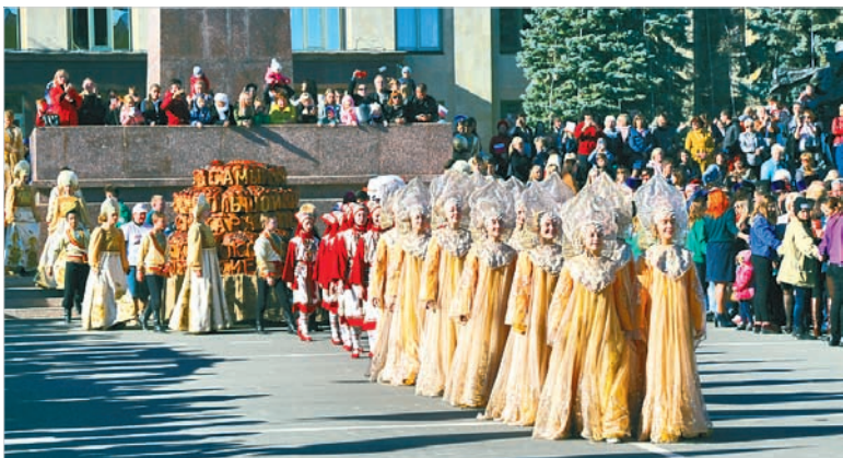
Хоровод дружбы начинает движение.

№ 211 (6573) • 7 НОЯБРЯ • СРЕДА • 2018 ГОД WWW.VECHORKA.RU