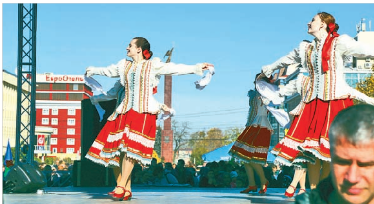
На сцене – лучшие творческие коллективы города.