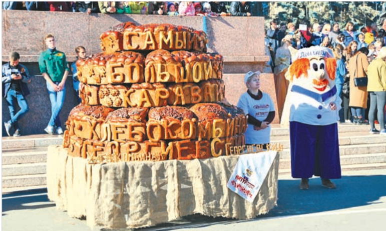
Пекари Георгиевского комбината испекли на праздник каравай весом более полутонны.

Елена ПАВЛОВА.