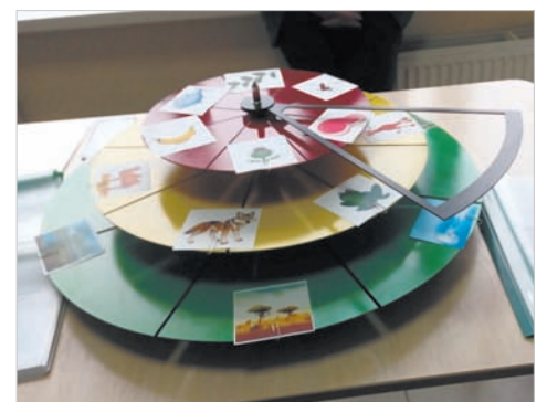
Круги Луллия: такое пособие нужно в детсаду.