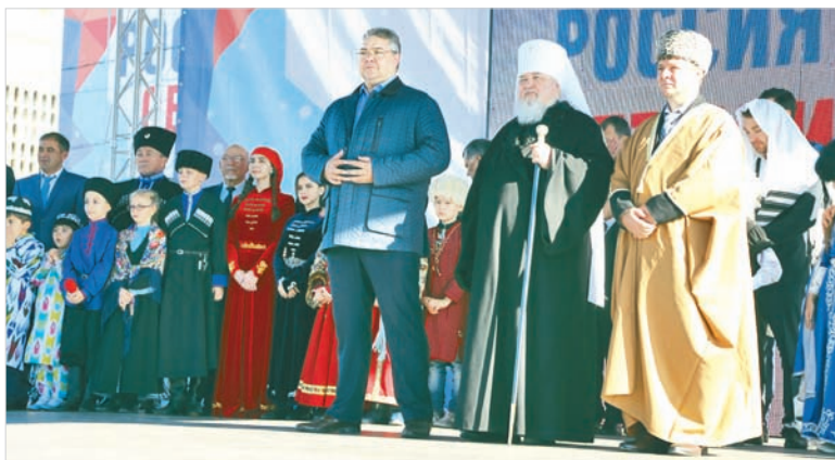
Руководители национально-культурных организаций поднялись на сцену вместе с детьми.

– Мы разные по своей вере, социальному положению, возрасту,