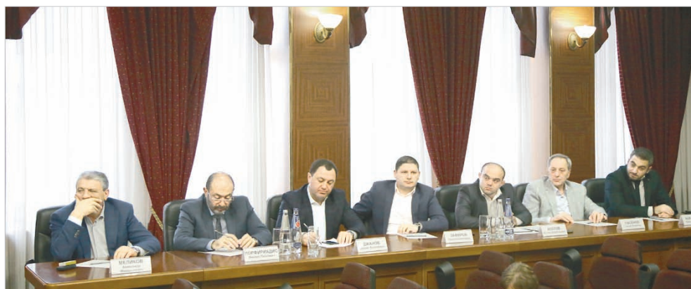
Представители греческой диаспоры.