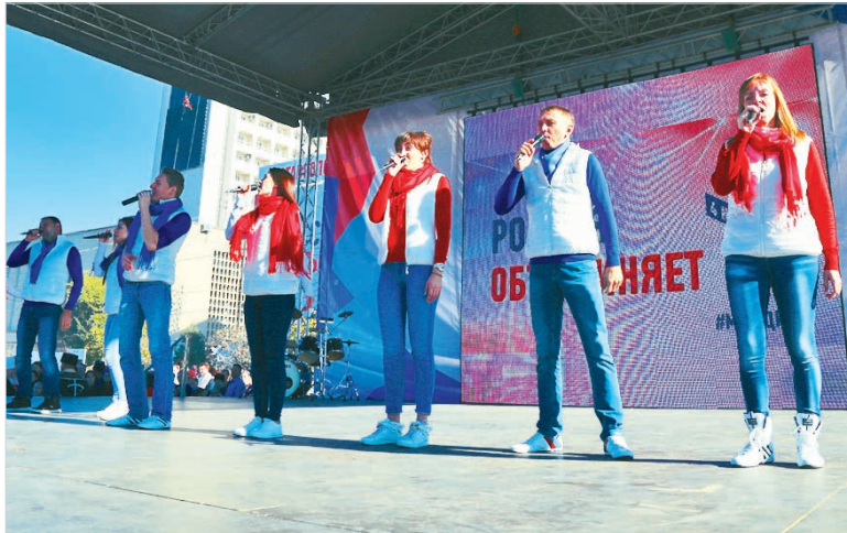
Звучит песня «Широка страна моя родная».