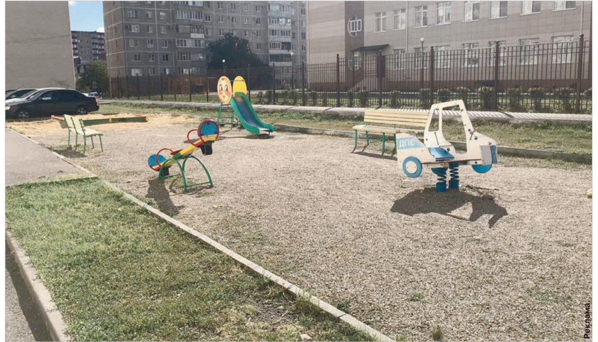
Скоро на этом месте будет оборудована новая детская площадка по индивидуальному проекту.

этому делу творчески. Хочется, чтобы она была не типовой, непохожей на другие, а была бы уютной, яркой и по-настоящему детской. Мы об-