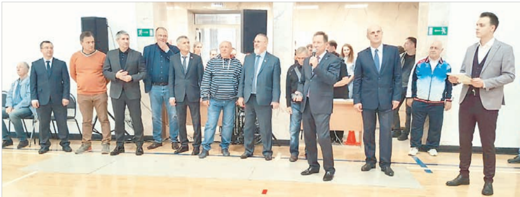
Почетные гости VII чемпиона СК по баскетболу.

В игровом зале спортивного комплекса Ставропольского государственного аграрного университета прошло торжественное открытие VII чемпионата Ставропольского края по баскетболу среди мужских команд производственных коллективов, городов и муниципальных образований на Кубок губернатора.