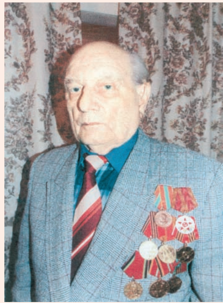
1941-1945 гг.». Имеет правительственные награды, инвалид 2-й группы.