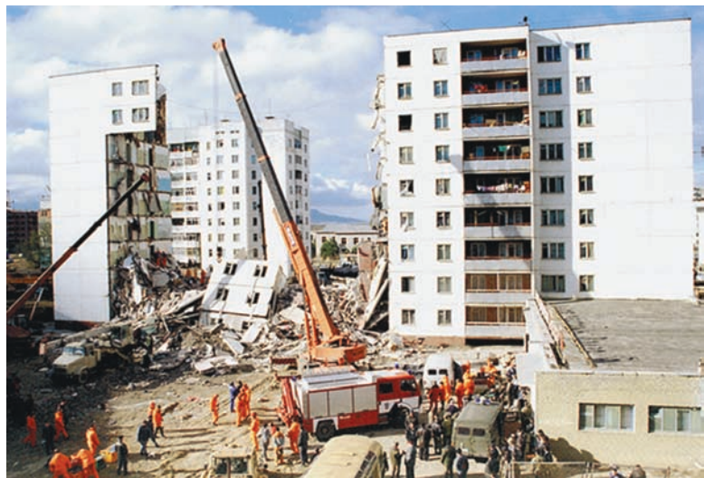
После взрыва завалы разбирали трое суток.

Шел 1996 год. Уже был пережит Буденновск, Кизляр - захваты заложников, гибель женщин и детей. Но слова «терроризм» и «теракт» еще не вошли в обиход и сознание людей. Еще не гремели взрывы на вокзалах, остановках, электричках в жилых домах Москвы и Волгограда... Первый такой взрыв прогремел в Каспийске — в доме, где жили семьи пограничников.