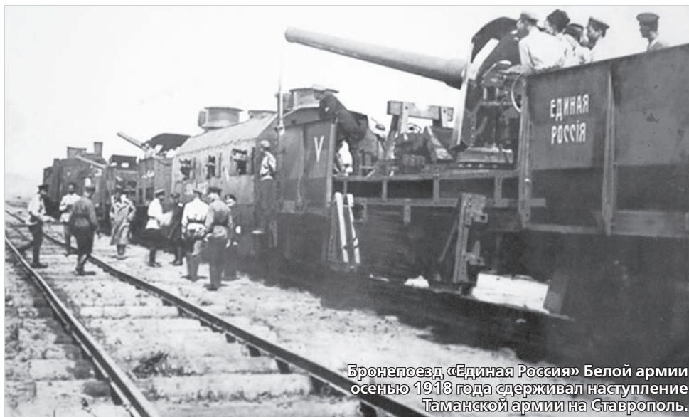
Бронепоезд «Единая Россия» Белой армии осенью 1918 года сдерживал наступление Таманской армии на Ставрополье.