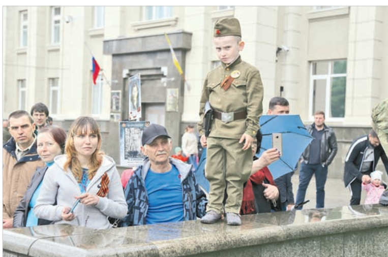
Отказаться из-за дождя участвовать в акции «Наследники Победы» не захотели даже самые маленькие ее участники.