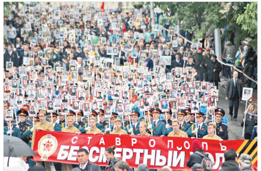
В шествии «Бессмертного полка» приняли участие порядка 60 тысяч ставропольцев.