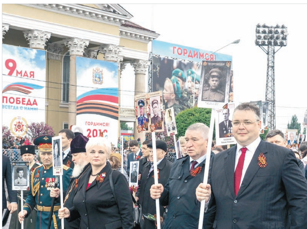
Руководители города и края – в рядах колонны «Бессмертного полка».

тановки. Ставропольцы приветствовали своих защитников громким «ура!», аплодисментами и фотовспышками. А потом над площадью на бреющем полете прошел небольшой учебный самолет, несший под фюзеляжем Знамя Победы.