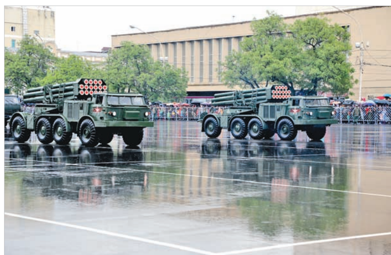
Новейшие системы залпового огня – уже на вооружении частей Южного военного округа.

Торжественным маршем прошли по площади военнослужащие частей Ставропольского гарнизона. В механизированной колонне насчитывалось около 50 единиц вооружения и военной техники, в том числе «Искандеры» и «Ураганы», бронетранспортеры, зенитные ус-