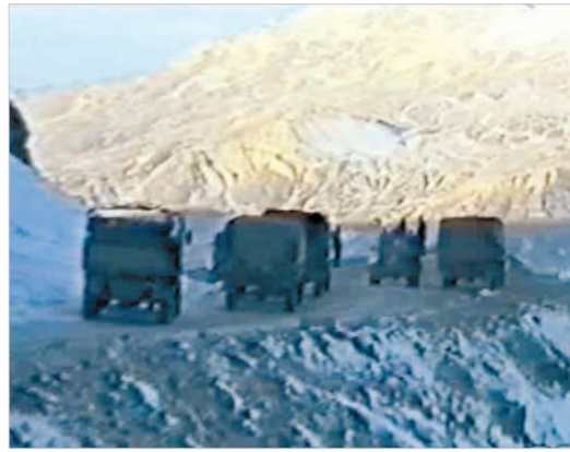
Слева – скала, справа – пропасть.

Наши американские «партнеры», как выяснилось, делали вложения в «капитальное и дорожное строительство». Из Панкисского ущелья в Чечню прокладывали дорогу – стратегически важный объект для полномасштабной поддержки «повстанцев». Бандитов и головорезов они именовали именно так.