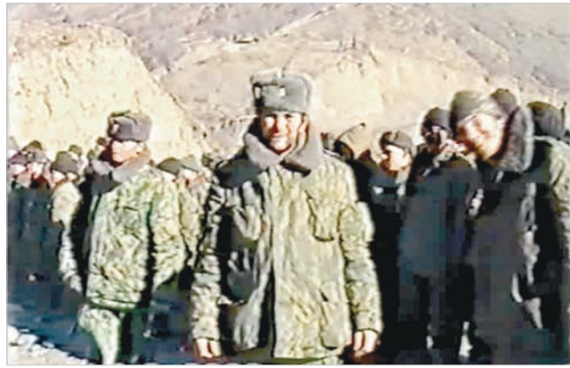
Задача выполнена. Потерь нет.