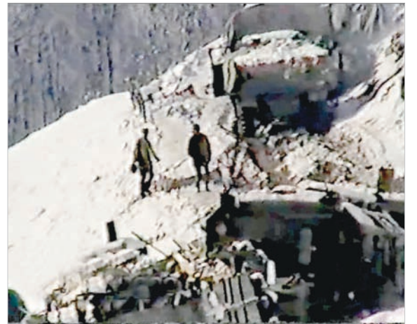
Техника штурмует перевал.