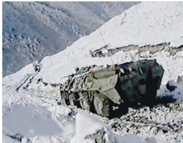
Снег в горах — дело серьезное.