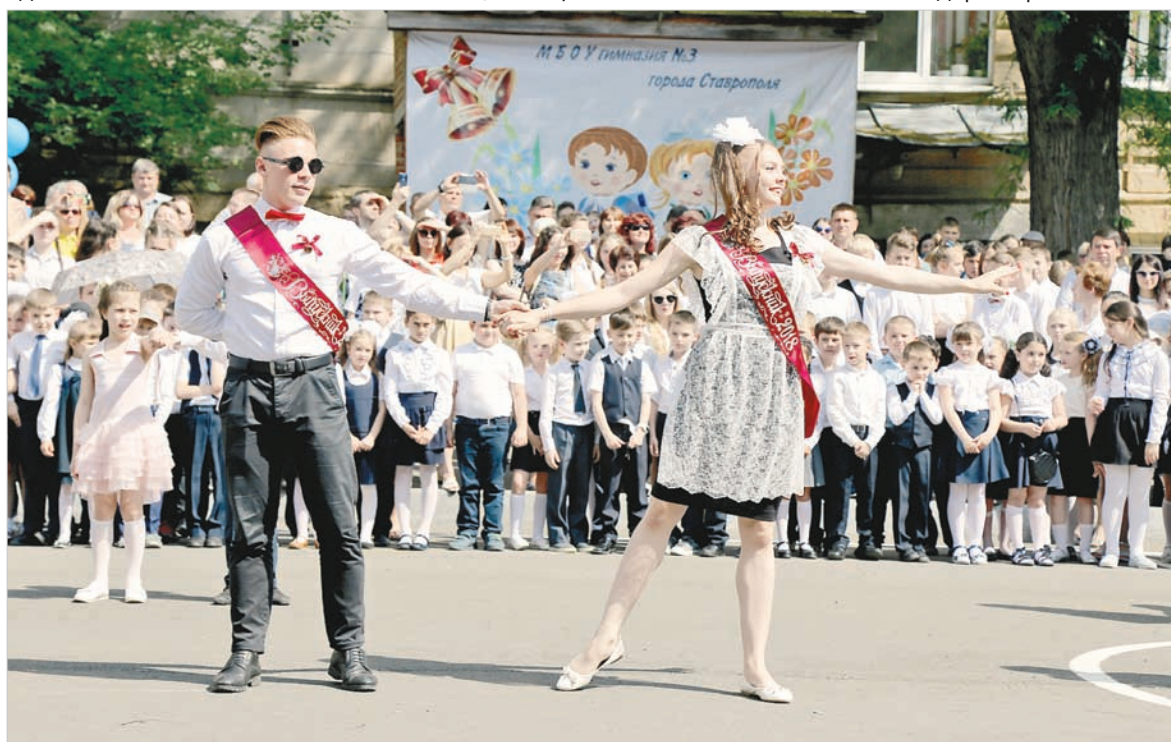
Традиционный вальс выпускников.