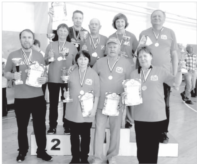
Сборная Ставрополя — чемпион спартакиады ветеранов.

Второе место с девятью очками досталось пятигорчанам, а на третье место вышли ветераны из Железноводска, на счету которых 16 очков.