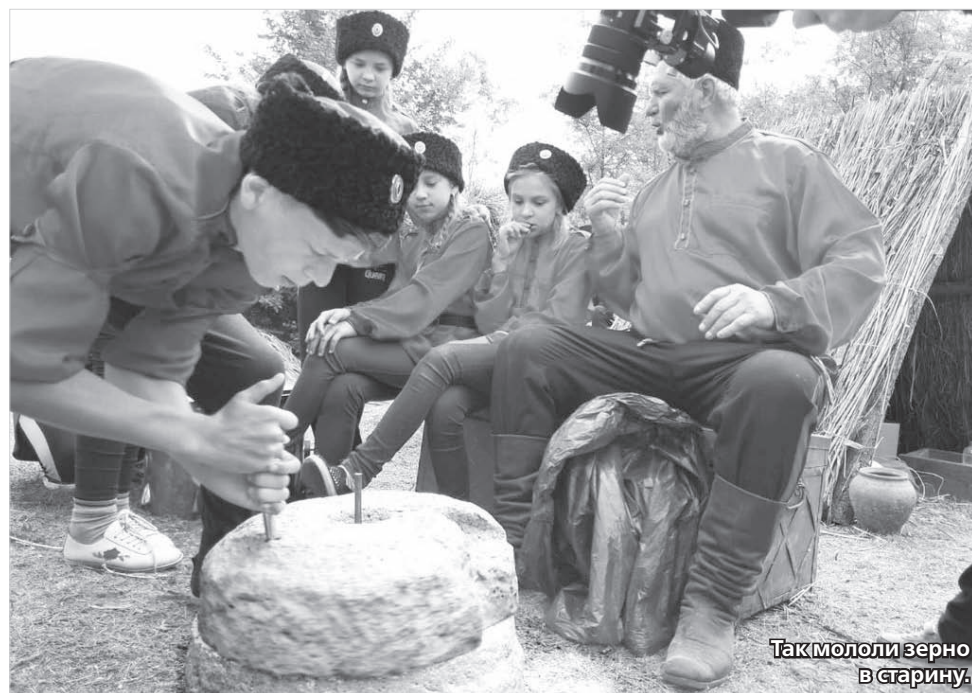
Так молили зерно в старину.