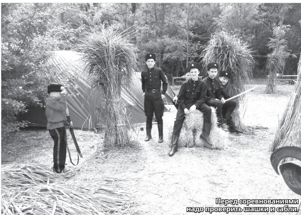
Перед соревнованиями надо проверить шашки и сабли.