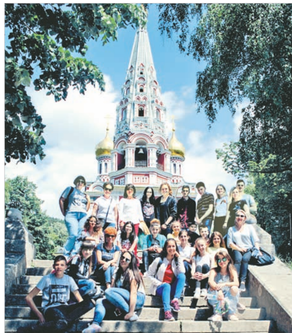
У храма Рождества Христова – символ славной победы в русско-турецкой войне и скорбь о погибших. Здесь в августе – декабре 1877 года проходила оборона Шипкинского перевала.

И конечно, в ходе такого вот неформального общения россий-