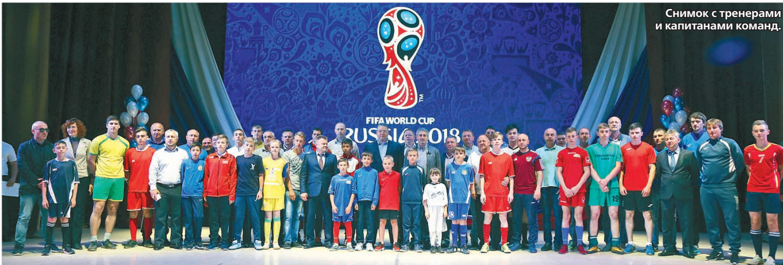
Снимок с тренерами и капитанами команд.