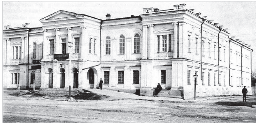
Ставропольское губернское казначейство располагалось в здании присутственных мест, ныне – ул. Советская, 3.

При вечерней проверке постов после восьми часов вечера было обнаружено невероятное: часовой исчез, оставив после себя лишь сумку с припасами и ружье, все три замка хранилища открыты – именно не взломаны, а открыты ключами, а ящик с деньгами, который весил не менее семи пудов, пропал. Разумеется, первым под подозрение попал именно часовой, но дело ослож-