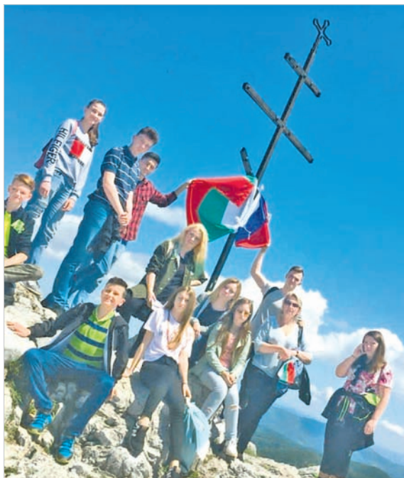
Гимназисты у памятного православного креста на горе Шипка.

Всему этому дополнительный импульс дает простая и давняя дружба с ребятами из Ставрополя, которые тоже хотят развивать двустороннее сотрудничество между нашими странами — на уровне детской дипломатии. А обмен опытом в области образования и воспитания подрастающего поколения, укрепление дружественных связей между школами России и Болгарии, знакомство с культурными традициями двух наших народов, с нашим общим