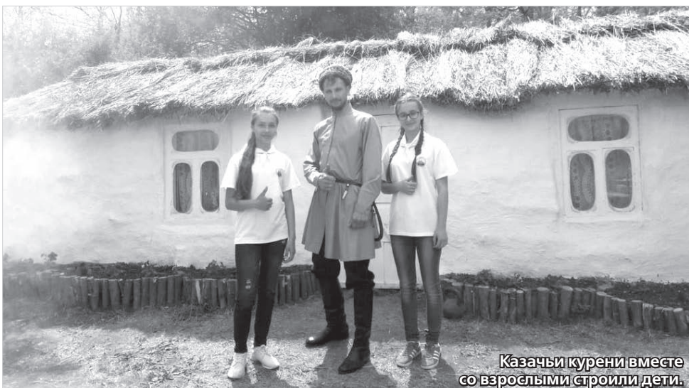
Казачьи курени вместе со взрослыми строили дети.