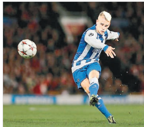
В атаке лидер сборной Франции Антуан Гризманн.

Англия), Антуан Гризманн («Атлетико», Испания), Киллиан Мбаппе («ПСЖ»), Усман Дембеле («Барселона», Испания), Набил Фекир («Лион»), Флориан Товен («Марсель»).