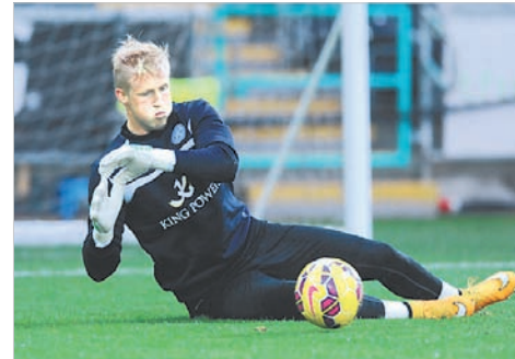
Вратарь сборной Дании и английского «Лестера» Каспер Шмайхель.

нападающие: Николай Йергенсен («Фейеноорд», Голландия), Юссуф Пульсен («Лейпциг», Германия), Мартин Брейтуэйт («Бордо», Франция), Андреас Корнелиус («Аталанта», Италия), Каспер Дольберг («Аякс», Голландия).