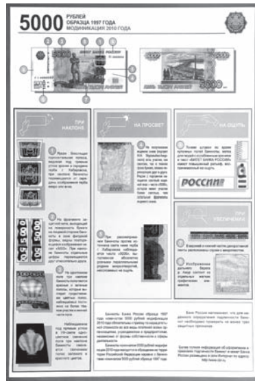
Степени защиты денежных знаков.

По данным отдела экономической безопасности и противодействия коррупции управления МВД по городу Ставрополю, больше других поражены сбытом фальшивок торговые сети – даже при условии, что у них есть специальные приборы для определения подлинности денег, в часы пик, когда идет большой наплыв людей (обычно вечером, после окончания рабочего дня), чисто физически кассир не успевает дотошно проверить каждую банкноту, которой расплатились покупатели. Особенно страдают те магазины, которые не оборудованы системами видеонаблюдения.