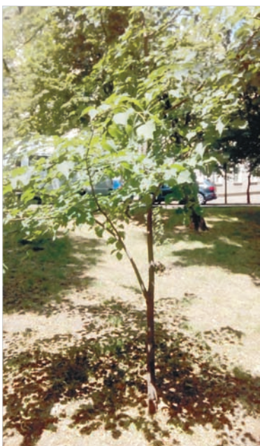
Молодые саженцы соседствуют со зрелыми деревьями на бульваре Ермолова.

Все работы планируется завершить к 1 сентября.