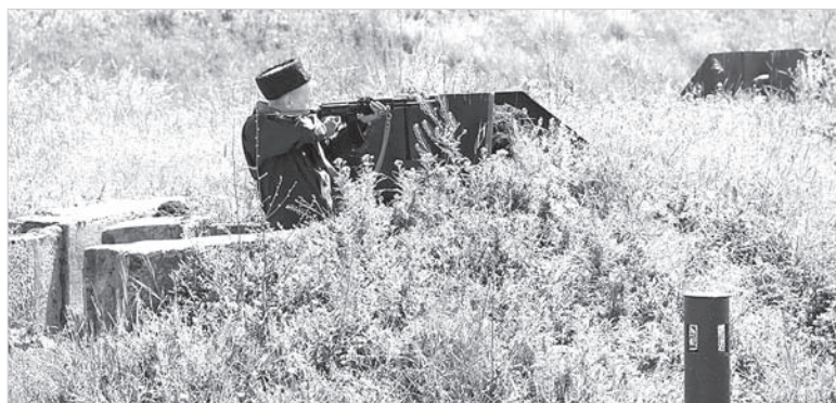
Атаманы приняли участие в занятиях по огневой подготовке.