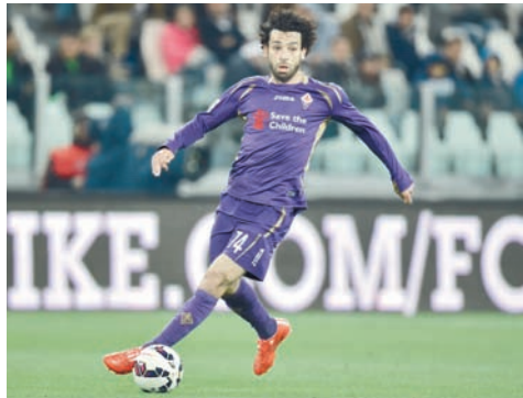
Лидер сборной Египта Мохамед Салах.

Отборочный турнир Египет прошел неплохо, в шести матчах с Угандой, Конго и Ганой одержав четыре победы, по разу проиграв и сыграв вничью, и с 13 очками занял первое место.