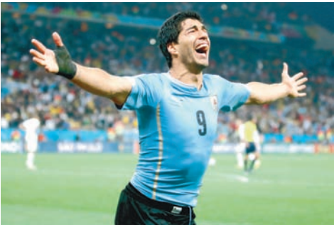
Главный бомбардир сборной Уругвая (50 голов) Луис Суарес.

Но, на мой взгляд, стержневой в команде считается линия полузащиты. Здесь собраны хоть и не звездные, но достаточно квалифицированные, а главное, сыгранные футболисты. Именно отсюда идет большинство угроз воротам соперника и здесь разрушаются атаки оппонентов. Так что и сборной России придется решать не только проблему нейтрализации грозного атакующего дуэта Кавани — Суарес, но и преодоление середины поля.