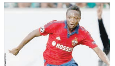
Капитан нигерийцев Ахмед Муса.

ла участие в отборочном турнире к Кубку африканских наций - 2012. Однако 4 октября 2010 года последовал новый запрет на международные матчи Нигерии — но теперь уже со стороны ФИФА за вмешательство государства в дела футбольной федерации.