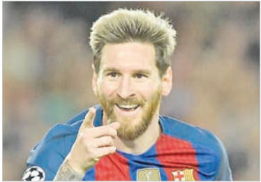
Главная звезда сборной Аргентины Лионель Месси.

Наибольшее количество матчей за сборную сыграли Хавьер Санетти и Хавьер Маскерано — по 143 игры; лучший бомбардир сборной — Лионель Месси — 64 мяча.