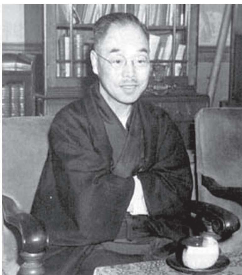
Кацудзо Ниши (Япония) - профессор, основатель системы здоровья.

«Удачи или поражения не приходят сразу. Человек создан из того, о чем он думал и что он делал в прошлом, о чем он думает, во что верит и как действует сейчас. Все это отразится на его будущем. Другими словами, прошлые мысли и вера утверждают вас в том, что будет с вами в будущем. Здоровы вы или нет - это результат того, во что вы верили и что делали в прошлом. Будете ли вы сильны или слабы в будущем - зависит от того, во что вы верите и как поступаете в настоящем. Как вода изменяет свою форму в соответствии с сосудом, так и