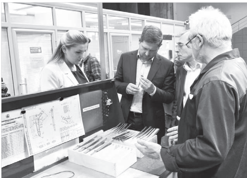
Представители «АМТ» знакомятся с производством элемента импланта.