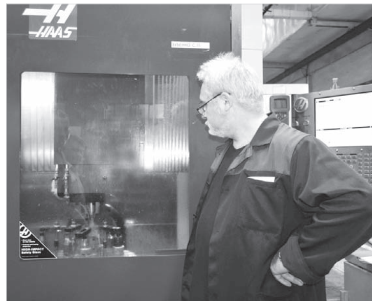
Идет первый этап обработки на «умном» станке.