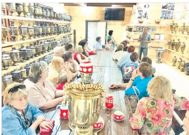
В музее самоваров.