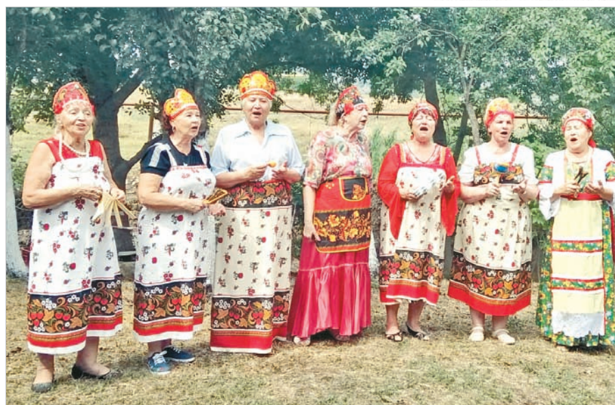
Ансамбль хора «Дети войны».