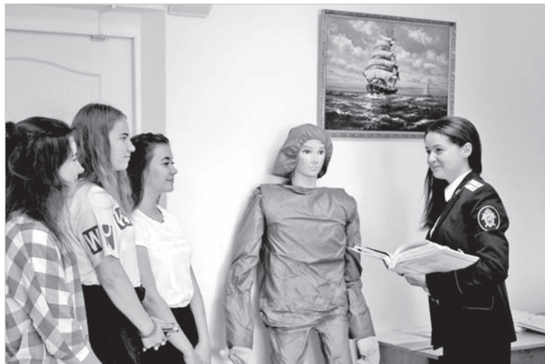
Ученики школы №1 Изобильного в гостях у следователей.

Экскурсия вызвала живой интерес у школьников, а некоторые из них признались, что она помогла им сделать окончательный выбор будущей профессии.