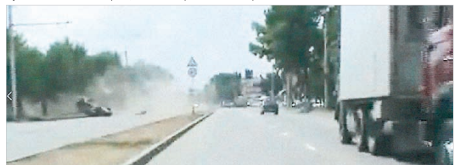
Полицейским пришлось догонять лихача, который в итоге перевернулся на автомобиле.

Мероприятия по профилактике автоаварий по причине несоответствия скоростного режима безопасному продолжаются: с 30 июля по 5 августа включительно на наиболее аварийных участках Ставрополья автоинспекторы снова измеряют скорость движения и привлекают к ответственности лихачей. Второй этап операции «Скорость» проводится на федеральной трассе «Кавказ», «Минеральные Воды - Кисловодск», на территории Шаповаловского и Изобильненского районов.