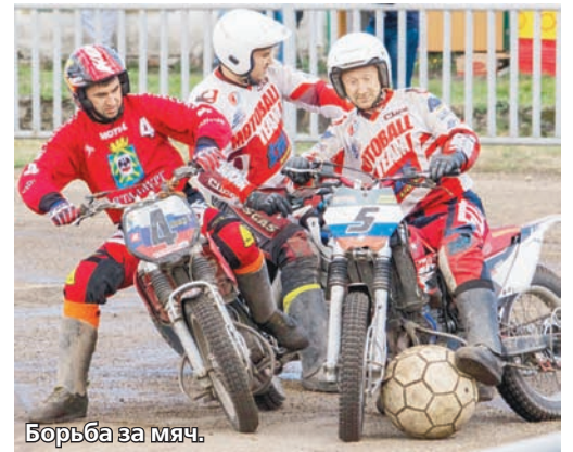
Борьба за мяч.

– Выступление «Колоса» в розыгрыше Кубка России, несомненно, стоит занести команде в актив, – прокомментировал министр физической культуры и спорта Ставропольского края Роман Марков. – Ребята сражались достойно и по праву заслужили серебряные медали. Будем надеяться, что «Колос» до конца чемпионата сохранит свое лидерское место в турнирной таблице.