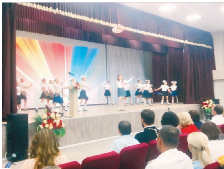
Детвора Ставрополя песней и танцем приветствует учителей, собравшихся на августовский педсовет.

Таковыми словами из песни детвора Ставрополя приветствовала педагогов города, собравшихся на традиционную августовскую педконференцию в минувший вторник в новой школе № 45.