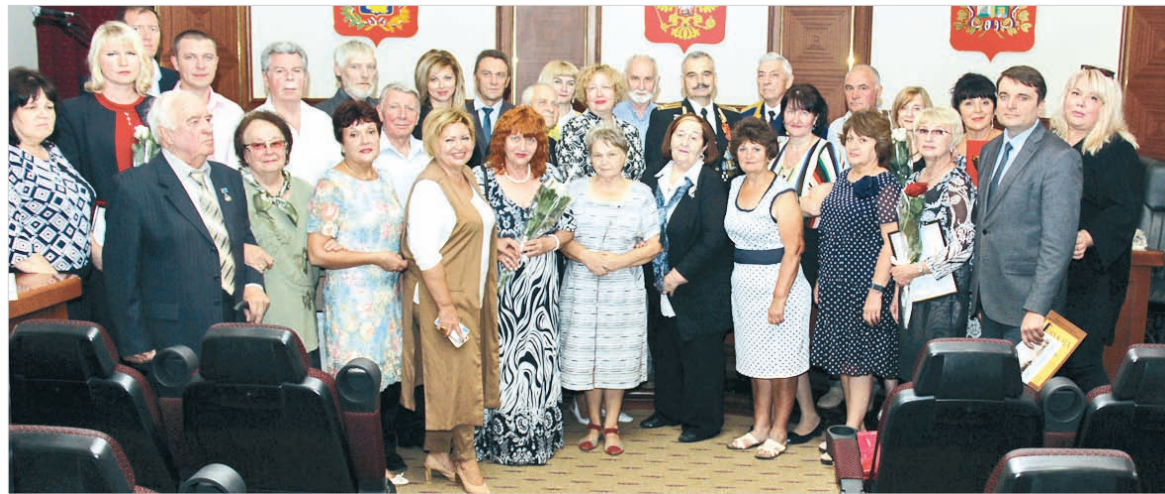
Традиционная фотография в память о встрече.