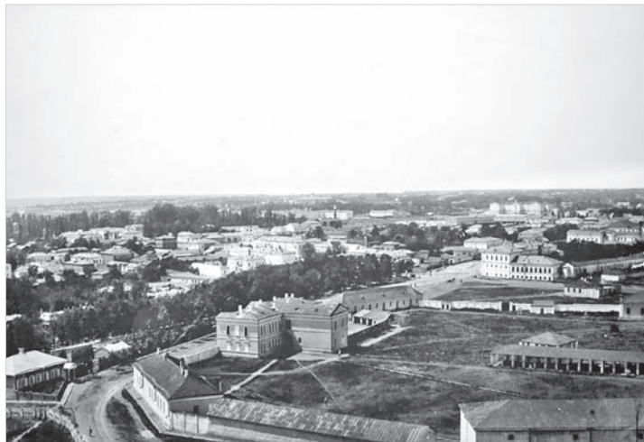
Территория Крепостной горы на фотографии начала XX века.