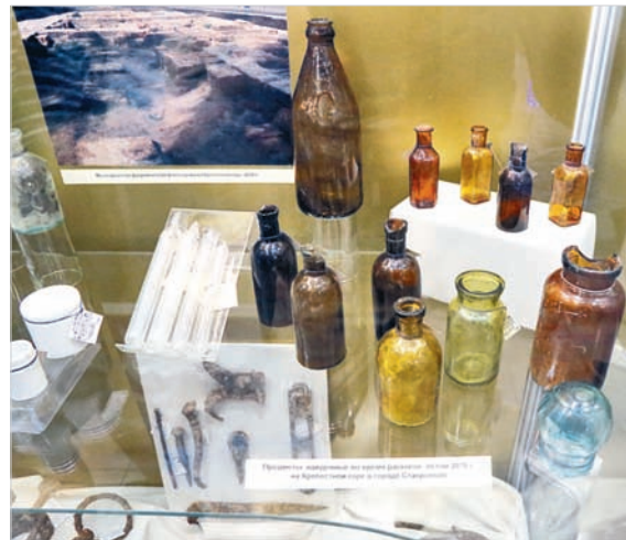
Материалы археологических раскопок 2018 года.