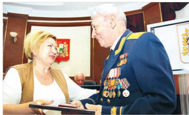
Татьяна Середина вручает памятный знак администрации города генерал-майору авиации Борису Аверину.

тии освобождения Северного Кавказа от немецко-фашистских захватчиков. За прошедшие годы интерес к теме войны не ослабевает, исследователи открывают новые факты, поисковики возвращают имена неизвестным героям, и эта деятельность вызывает поддержку со стороны общества и государственных органов.