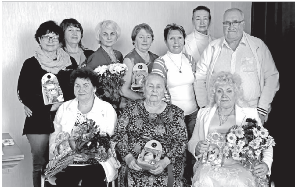
Снимок на память.

Вместе они создают общую «картинку», которая так нравится гостям нашего города.