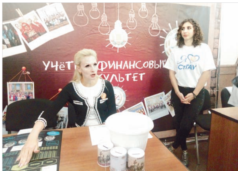
О финансовой грамотности рассказали в форме викторин и деловых игр.

На самом деле нечасто такое можно увидеть: двери Ставропольского отделения Банка России, расположенного на улице Ленина краевого центра, не просто открыты нараспашку, но еще и украшены гирляндами из шаров, как бы приглашая заглянуть сюда всех прохожих. В обычные дни к этому красивейшему зданию, построенному в самом начале прошлого века, просто так не пойдешь, сразу станешь объек-