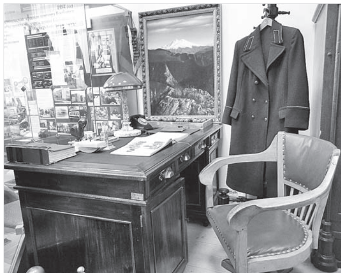
Рабочее место управляющего банком.