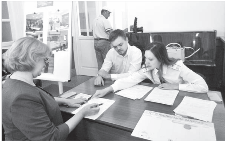
Специалисты ФНС помогли открыть Личный кабинет налогоплательщика.

Конечно, День открытых дверей не ограничился развлечениями: специалисты банка провели несколько лекций и мастер-классов по финансовой грамотности. К примеру, у стенда «Наши деньги» рассказали об основных элементах защиты денежных знаков от подделки; отдельно сотрудники ведомства презентовали платежную карту «Мир», развеяв многочисленные сомнения держателей карт; интересные нюансы о валютных операциях и инфляции