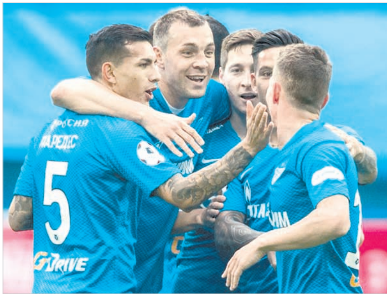
Группа атаки «Зенита».

Тут же хозяйева были обязаны счет удвоить. Дзюба почти в центре поля отнял мяч у соперника, бросил в прорыв по правому флангу Игоря Смольникова, кото-