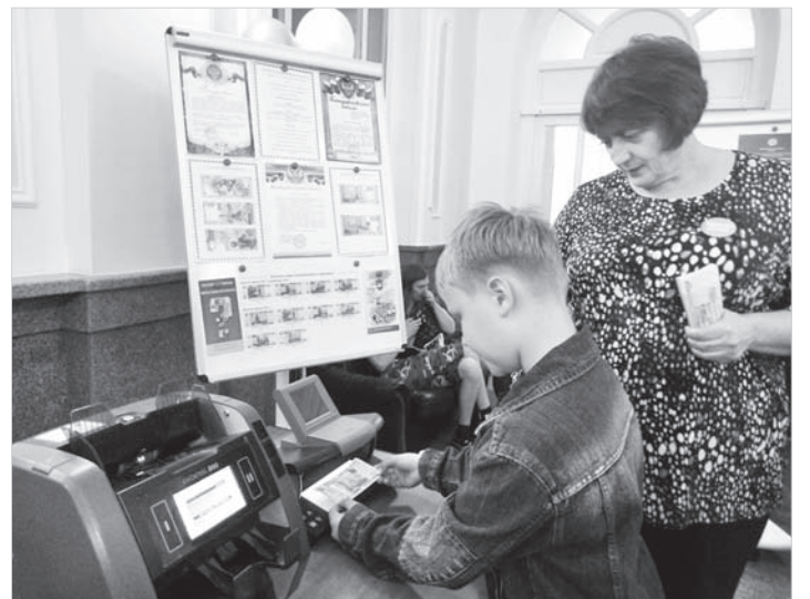
Здесь же можно было проверить купюры на подлинность и узнать об основных элементах защиты банкнот.