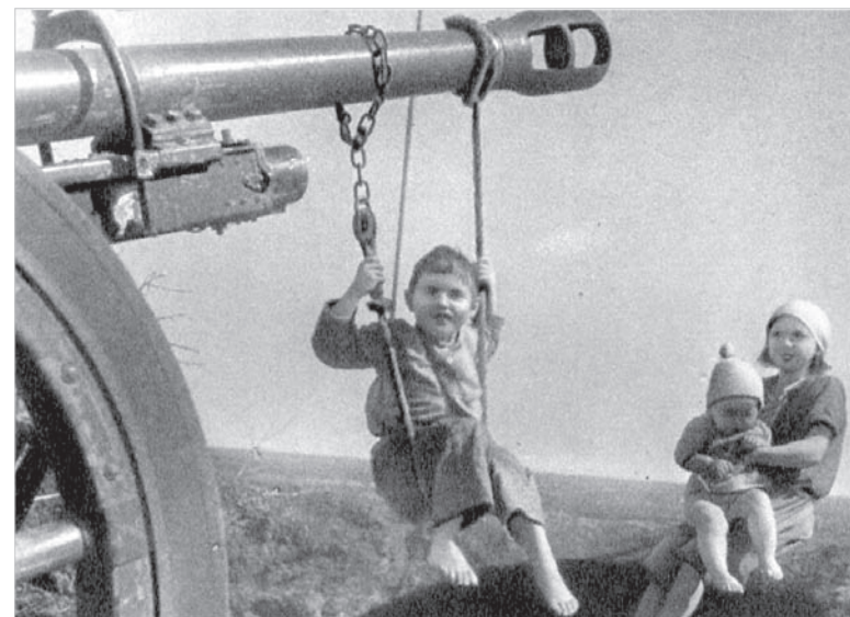
Детские качели на оставленной вермахтом технике (из фондов Государственного архива Ставропольского края).