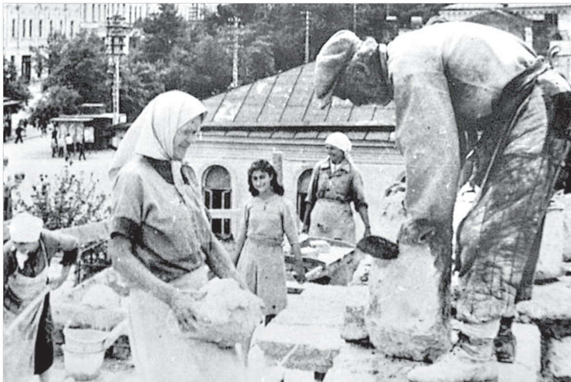
Ставропольцы восстанавливают драматический театр.