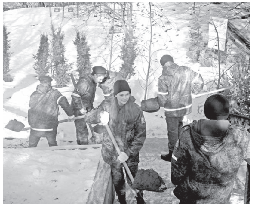
Кадеты-добровольцы очищают родник.