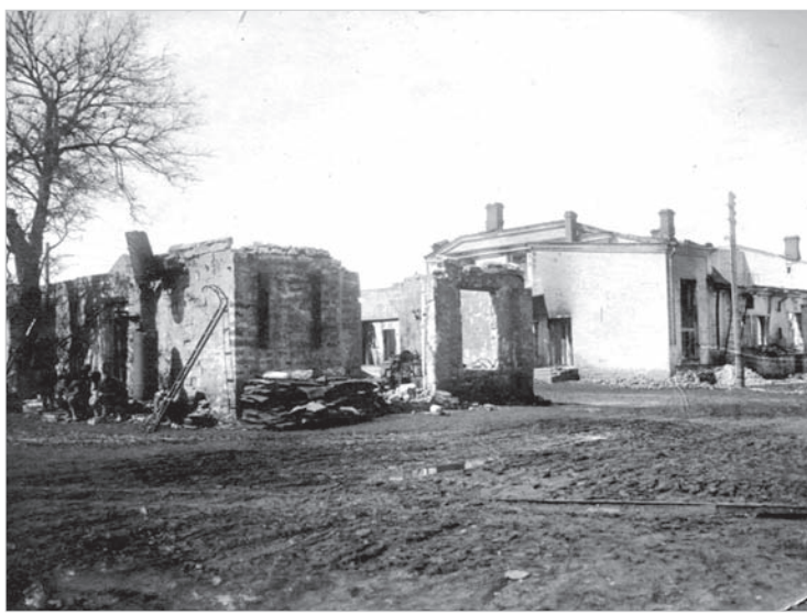
Завод «Красный металлист», разрушенный во время оккупации.