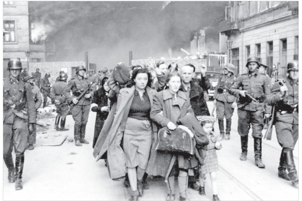
Переселение в варшавском гетто.

27 января – день, с которым в военной истории России связано многое: это и окончательное снятие блокады Ленинграда в 1944-м, и освобождение солдатами Красной Армии лагеря смерти Освенцима в 1945 году. Спустя 60 лет Генеральная Ассамблея ООН принимает резолюцию, в которой объявляет 27 января Международным днем памяти жертв холокоста.