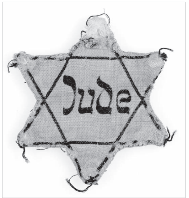
Нагрудная желтая звезда. (Из фонда Еврейского музея в Берлине.)