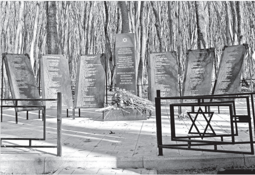
Мемориал жертвам холокоста в Ставрополе.