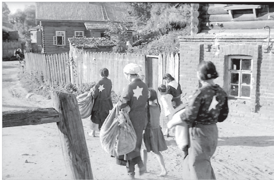
Евреи на деревенской дороге в Могилеве.

с оставшимся населением. Так, меньше чем за два месяца оккупации было расстреляно или убито в «душегубках» (автомобилях с герметичным кузовом, в который поступал выхлопной газ. – Прим. ред.) около 20 тысяч человек. Только в Ставрополе погибли четыре тысячи человек, в числе которых 660 душевнобольных и 33 сотрудника Ставропольского медицинского института. Но в большинстве своем еврейское население Ставрополя периода Великой Отечественной войны – эвакуированные в тыл советские граждане, преимущественно дети, женщины и старики.