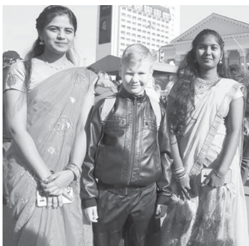
Иностранцы студенты тоже приняли участие в праздничном шествии.