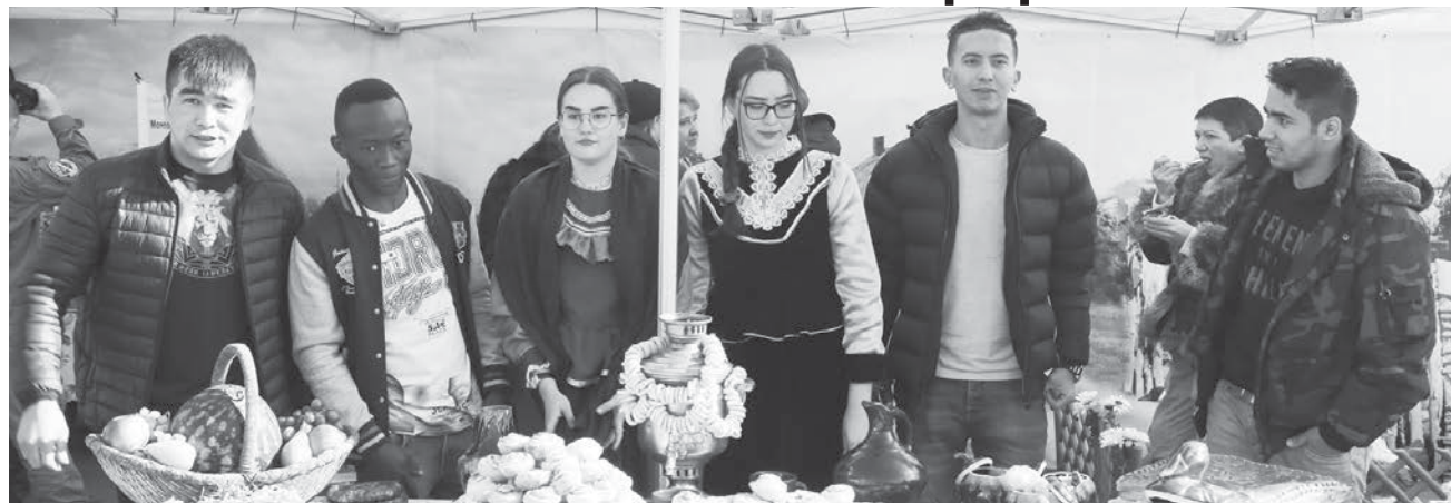
Казачки встречают гостей.