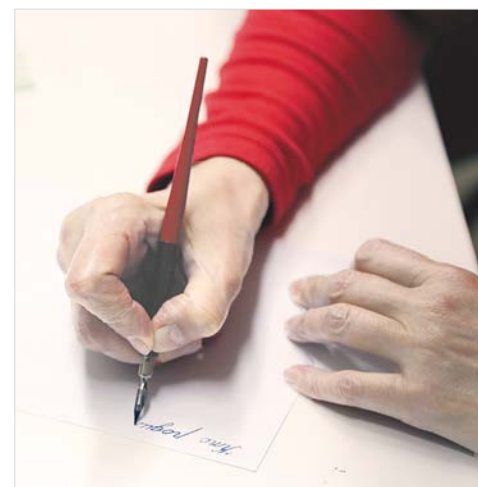
В «Ночь искусств» открылся VIII ежегодный конкурс каллиграфических работ «Пиши красиво».

Ольга МЕТЕЛКИНА.