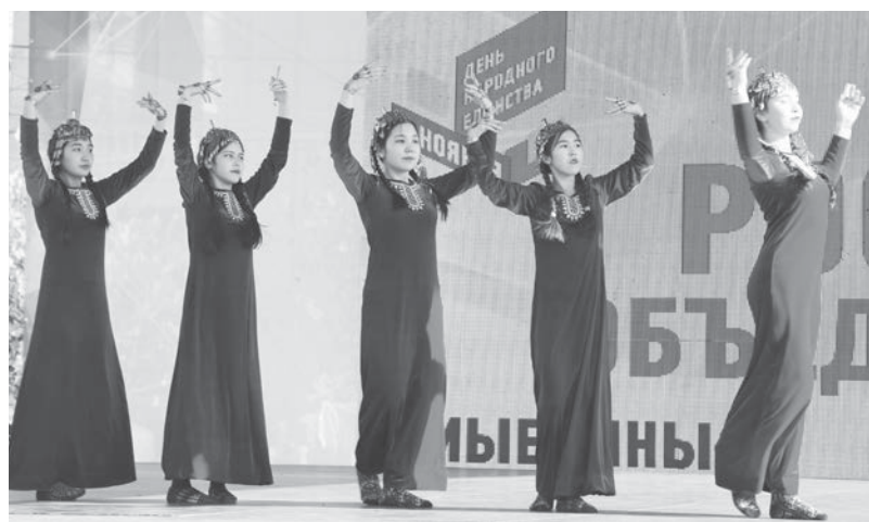
В День народного единства ставропольцам демонстрировали свое искусство национальные художественные коллективы со всего края.

Елена ПАВЛОВА.