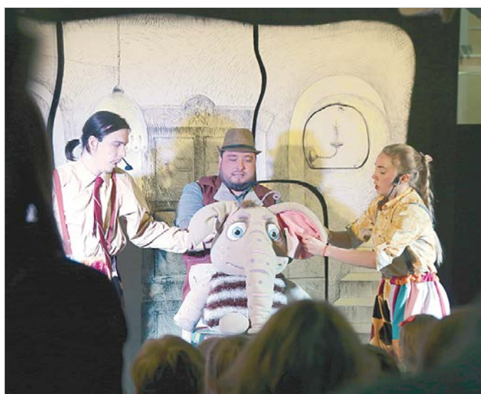
В Ставропольском музее-заповеднике. «А когда вылетит птичка?». «Слономух» в гостях у Нюси и Архипа в музее-заповеднике.