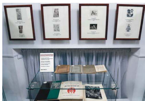
На выставке экслибриса.

В этом году «Ночь искусств» проходила под девизом «Искусство объединяет», который оказался созвучен всем представленным программам. Искусство объединило художников, артистов разных жанров, музейных работников, библиотекарей и всех тех, кому их деятельность и творчество адресованы. В то время когда в зале на Карла Маркса, 76, шёл концерт участников клуба авторской песни «Этюд», в здании музея на улице Дзержинского, 115 - 119, развернулась своя программа. Лично меня поразил «парад раритетов» на выставке «Артефакт» из коллекции музея. Проект участвует в одноименном проекте Министерства культуры России. Кто-то из посетителей, увидев полотна, составляющие золотой фонд изомузеев, был удивлен, что в Ставрополе можно увидеть работы И.К. Айвазовского, А.М. Васнецова, А.И. Мещерского.