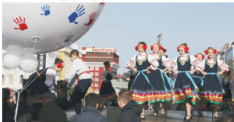
На сцене — лихая казачья пляска.