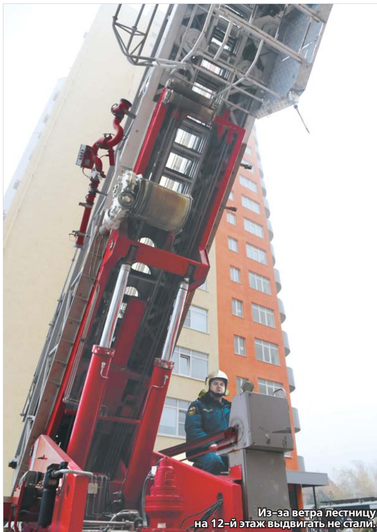
Из-за ветра лестницу на 12-й этаж выдвигать не стали.