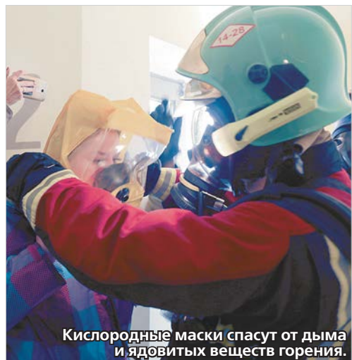
Кислородные маски спасут от дыма и ядовитых веществ горения.