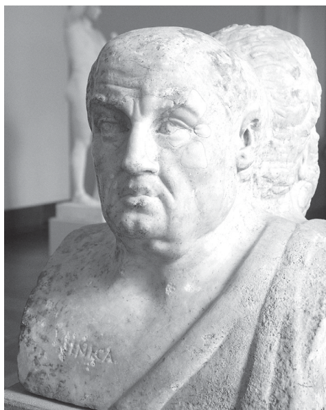
Двойная герма Сократа и Сенеки (Античная коллекция. Берлин).

Итак, всегда надо обращать внимание на то, учит ли учитель добродетели или нет; и если он не учит ей, его наука ниче- го не дает, если же он учит добродетели, то он – философ. Историки не ленятся исследовать вопрос, где скитался Одис- сей – между Италией и Сицилией или за пределами известного нам мира, ибо, ка- залось бы, нельзя блуждать так долго в столь тесном пространстве. А между тем нас самих ежедневно носят душевные бури, а наша немощь подвергает нас во все беды, испытанные Одиссеем. Тут нет не- достатка ни в чудовищах, упивающихся человеческой кровью и поющих коварные льстивые речи; есть и кораблекрушения и все разнообразие бедствий. Итак, на-