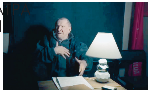
Кадры из документального фильма «Данилыч».

были представлены 253 фильма из России, Украины, Беларуси, Грузии, Армении, Молдовы, Боснии и Герцеговины, Латвии, Литвы, Италии, Германии, Финляндии, Польши, Швеции, Бразилии и Кубы.