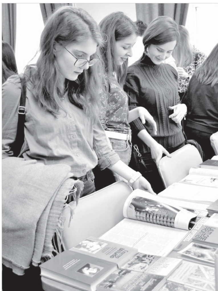
Выставка немецкой литературы и журналов в научной библиотеке СКФУ.