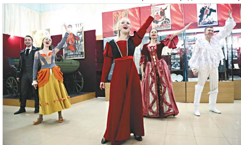
На презентации выставки выступили актеры Ставропольского театра драмы имени М. Лермонтова.

Ольга МЕТЕЛКИНА.