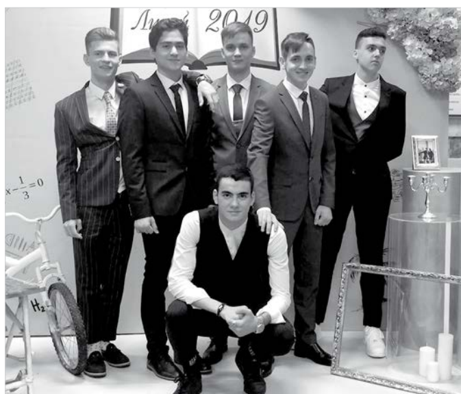
Вчерашние сорванцы – сегодня настоящие джентльмены.

чки, меняя классические туфли на кроссовки и кеды. Ведь важно, чтобы этот праздник запомнился не стертymi в кровь ногами, а хорошим настроением, душевным общением с друзьями, первым рассветом новой жизни.