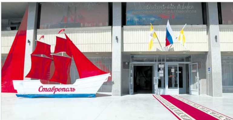
Красная дорожка и бригантна под алыми парусами ждут золотых и серебряных медалистов Ставрополя.