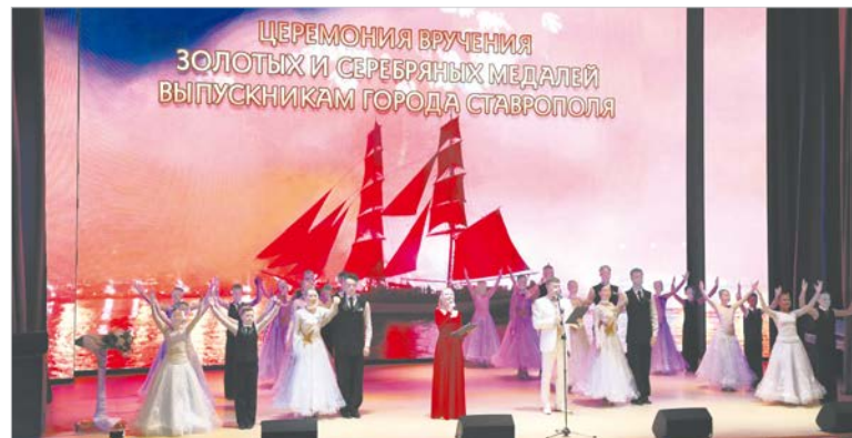
Торжество начинается ярко!