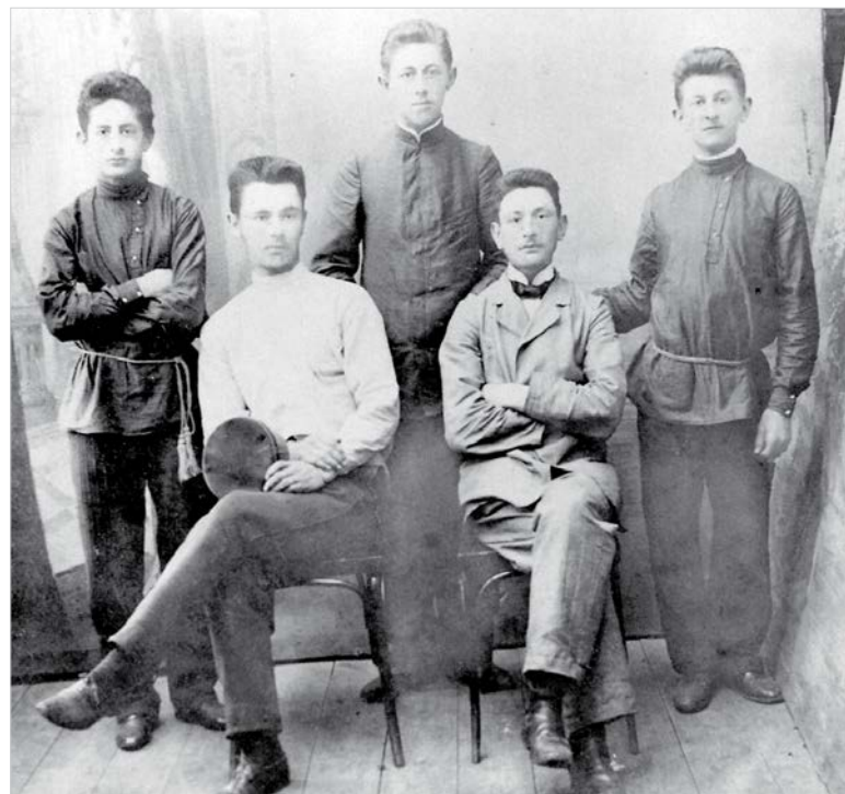
Молодые братья Френкель с родственниками.

Мой отец сомневался, стоит ли эвакуироваться. Но в 1914 году он оканчивал учебу на медицинском факультете в Мюнхене и хорошо помнил, как после объявления о вступлении России в Первую мировую войну «культурные и воспитанные» немцы палками прогоняли российских студентов из университета с криками «...убирайтесь вон!...». Мы пошли к деду, человеку мудрому, обладавшему огромным жизненным опытом, и стали советоваться с ним, как поступить. Хорошо помню его слова: «Я всю жизнь давал советы людям, но сейчас не могу взять ответственность за судьбу моей семьи. Есть тому две причины. Я видел, как немцы в 1918 году дружелюбно относились на Украине к гражданскому населению, и мне трудно поверить, что они стали убийцами. Вторая причина – тех, кто бежал с Моисеем из египетского рабства, погибло во много крат больше, чем тех, кто остался. Я не знаю, какое решение принять...» Отец сказал мне: «Дедушку одного мы оставить не можем. Ты уходи,