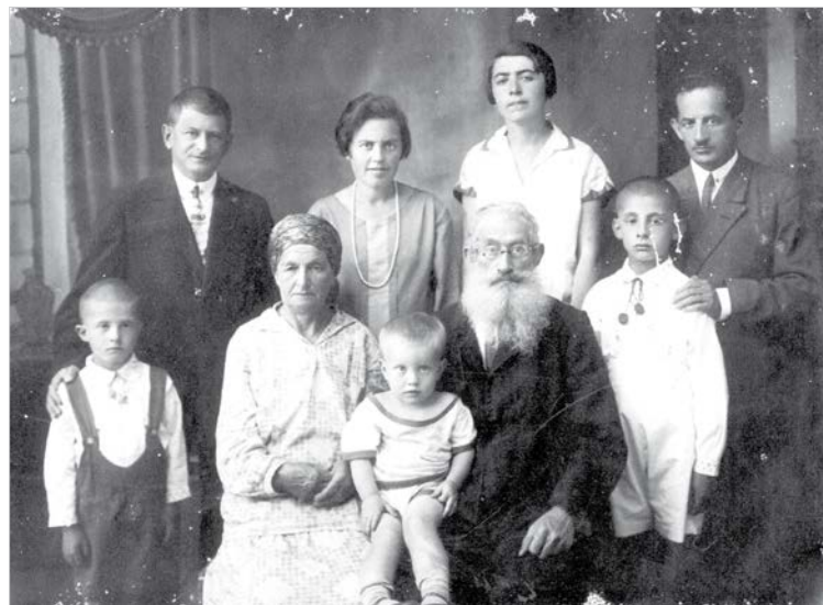
Братья Френкель с семьями.