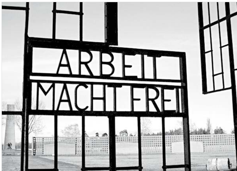
«Работа освобождает». Ворота концлагеря Заксенхаузен.

Заксенхаузен начинает свою историю практически одновременно с открытием летних Олимпийских игр 1936 года в Берлине. Этот факт красочно демонстрирует все лицемерие нацизма: пока одних сествуют на современном стадионе в свете прожекторов «Храма света», другие, лежа без сил на барачной койке, подумывают о том, чтобы свести счеты с жизнью, прыгнув на колючую проволоку с током, пото-