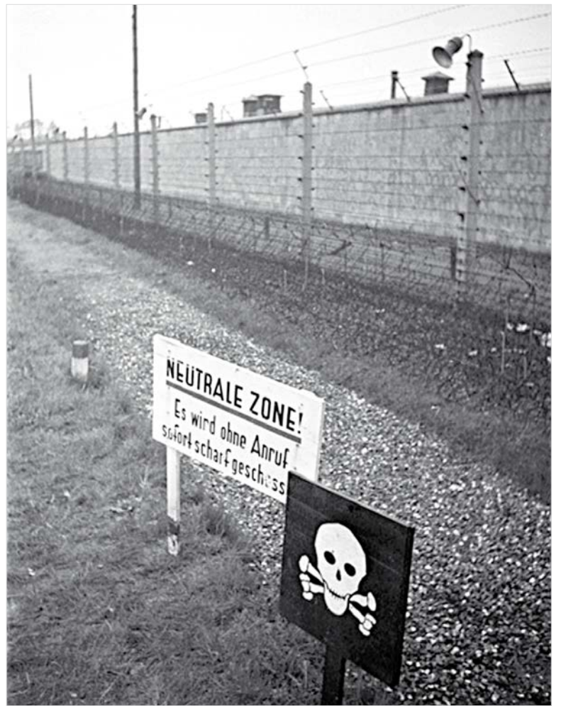
Концлагерь Заксенхаузен. Колючая проволока под высоким напряжением (1945 год).