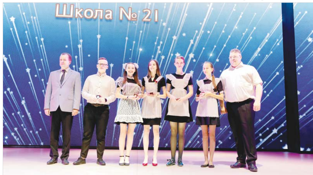
Губернатор Ставропольского края только что вручил медали выпускникам 21-й школы краевого центра.

В этом году медалистами стали 306 человек, из них золотую медаль получили 212 выпускников, серебряную - 94.