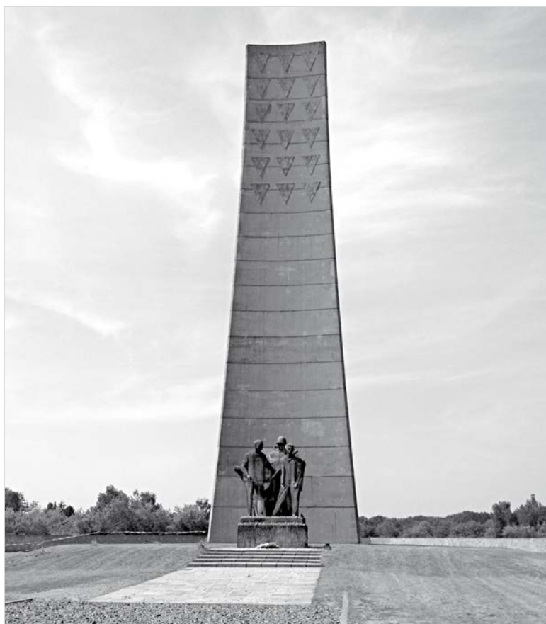
Обелиск 1961 года «Национальный мемориал и место памяти». (Фото: tinytinotravel.files.wordpress.com).