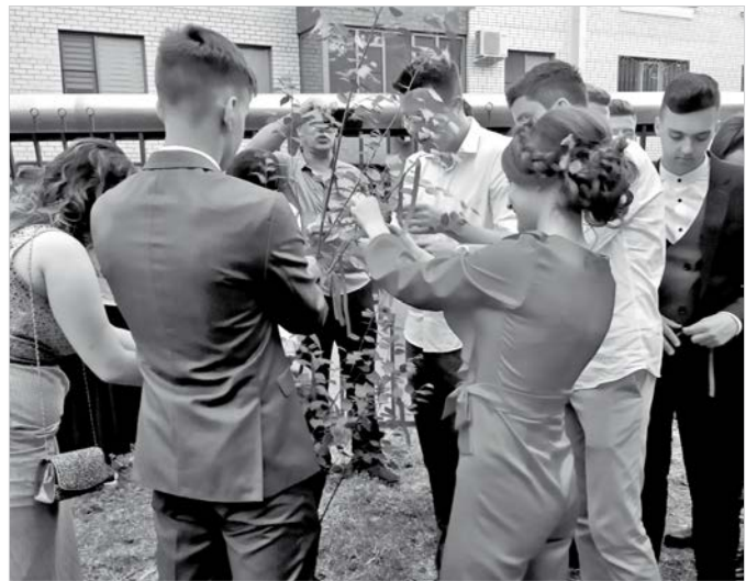
На деревьях будущей аллеи Выпускников ребята завязали ленточки «на исполнение желаний».

Кстати, современные подростки, как выяснилось, «смотрят вглубь» и не так уж сильно ценят внешнюю сторону жизни: после окончания торжественной части праздника многие девочки сменили наряды «в пол» на короткие платья, юбки и брючки, а туфельки на шпильках – на балетки. Переобувались даже маль-