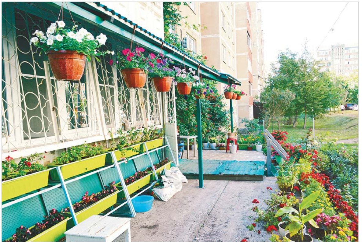
Лоджия в цветочном обрамлении.