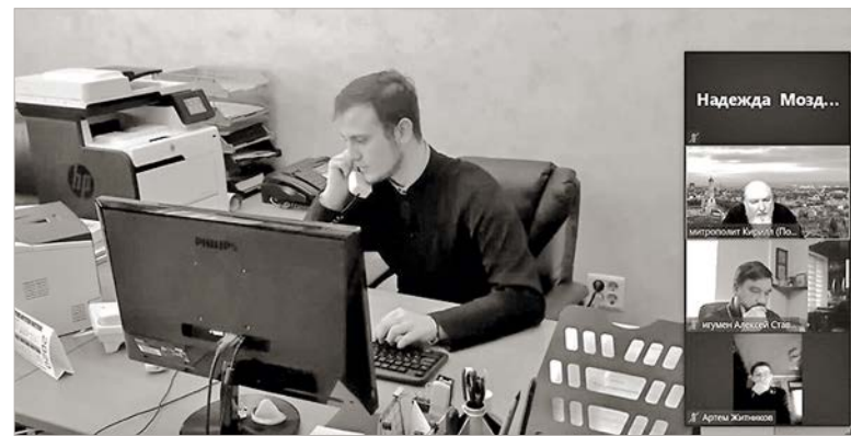
На видеоконференции с участием преподавателей и студентов Ставропольской духовной семинарии.