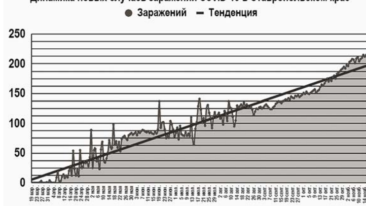
Динамика новых случаев заражений CoViD-19 в Ставропольском крае