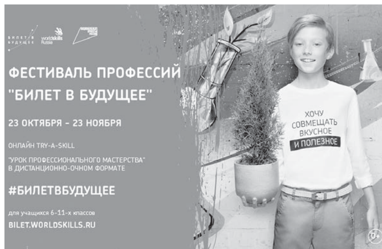
Фестиваль профессий «Билет в будущее» пройдет в дистанционно-очном формате.

Результатом этих самых проб должно стать построение молодым человеком своего профес-