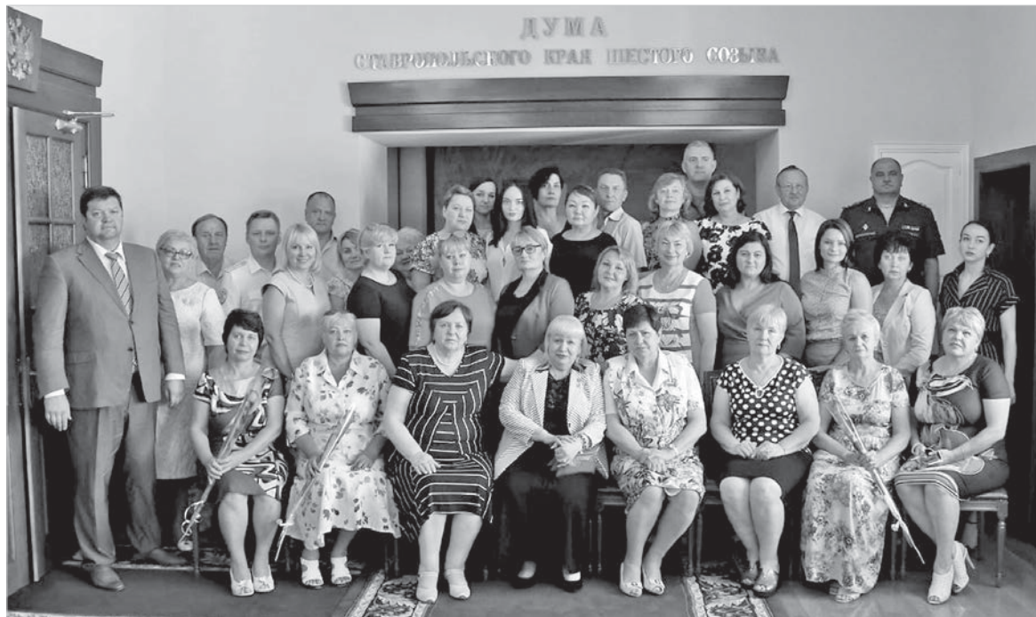
Союз семей погибших защитников Отечества в краевой Думе.

и в жизнь этой организации — нет возможности пойти в театр, где женщинам предоставляли абонементы, нет концертов, которые проводил для них Дом офицеров, да и психологические тренинги на природе с ласковым названием «Берегиня», которые проводили опытные специалисты, тоже приходится переносить до лучших времен. Наступят же они когда-нибудь. Речь не об этом. Речь о людях. О силе духа и силе любви, которая помогла выстоять им самим поднять и поставить на ноги детей, а теперь помогает растить внуков и жить самим и радоваться этой жизни... И не потому, что «время лечит». Во всяком случае мне ни разу не приходилось слышать, чтобы кто-то из потерявших сына или мужа на войне согласился с верностью этой поговорки. Нет, не лечит, стремительно летящие годы и десятилетия не у всех даже притупляют боль потери. Происходит другое — обретение нового смысла жизни.