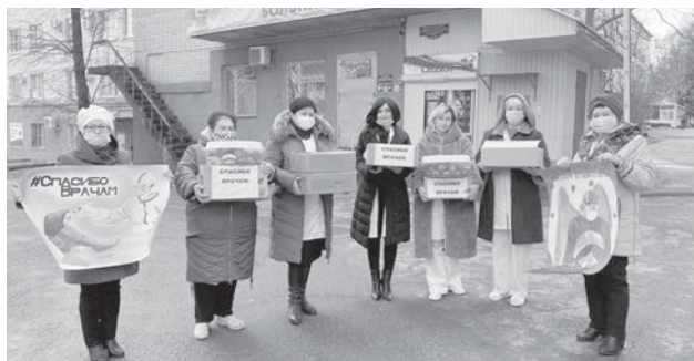
В городской клинической больнице №2.