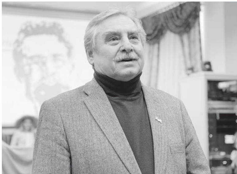
Исполняющий обязанности председателя Ставропольского отделения СТД РФ заслуженный артист РФ Борис Щербаков. (Фото Маргариты ВОРОНОВОЙ).