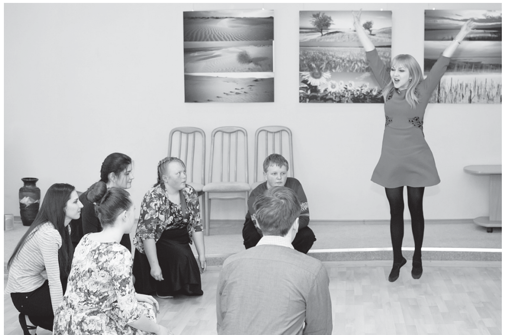
Занятие в Школе ораторского искусства ведет заслуженная артистка РФ Светлана Колганова.